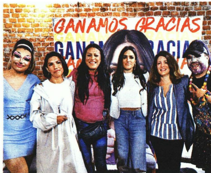
La alcaldesa electa anunció cinco ejes de gobierno.

Para agilizar el proceso de transición, Rojo de la Vega anunció los primeros cinco ejes con los que cimentará su gobierno, entre los que destacan el respeto de los derechos humanos de todos los ciudadanos, la inclusión de mujeres, mejorar la seguridad pública, el desarrollo sustentable de la ciudad y mejorar las prácticas gubernamentales para disminuir la corrupción. —