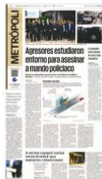
Ilustración: Iván Vargas/EL UNIVERSAL