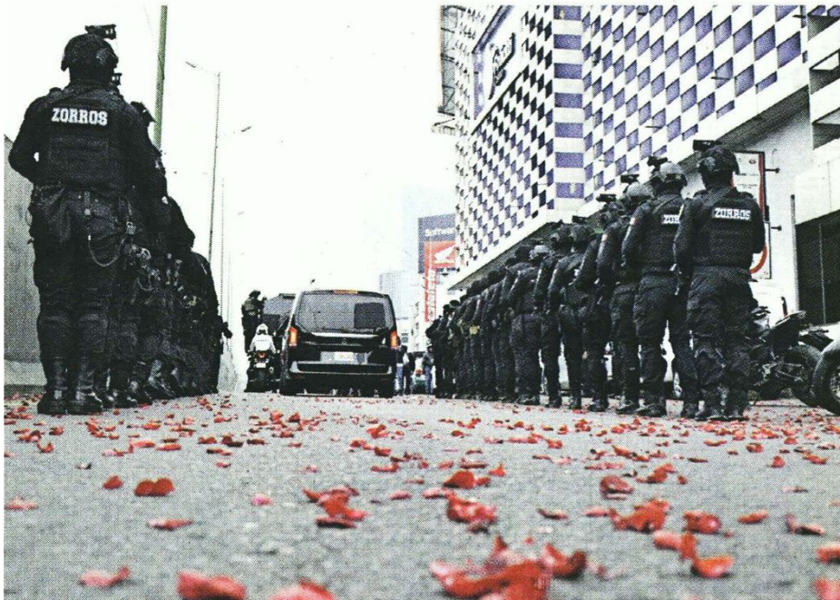
■ Morales fue despedido con una lluvia de pétalos y el Toque de Silencio de bandas de guerra.