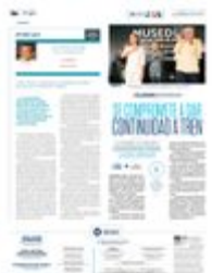
CAMPECHE | • Sheinbaum y el Presidente inauguraron el museo Edzná.