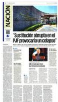
En conferencia, el Jefe del Ejecutivo pidió no aplicar tácticas dilatorias en el caso de la reforma al Poder Judicial.