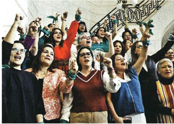
■ En el interior, legisladoras acusaban que la iniciativa fue objeto de una campaña de mentiras.