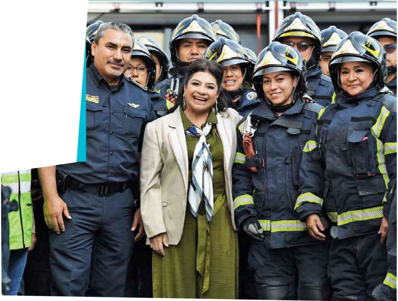
REFUERZO. La jefa de Gobierno destacó que los vulcanos ahora cuentan con 293 vehículos.