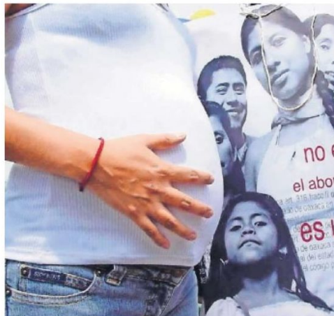
Se debe “desestigmatizar” la práctica del aborto después de las 12 semanas de gestación: expertos.