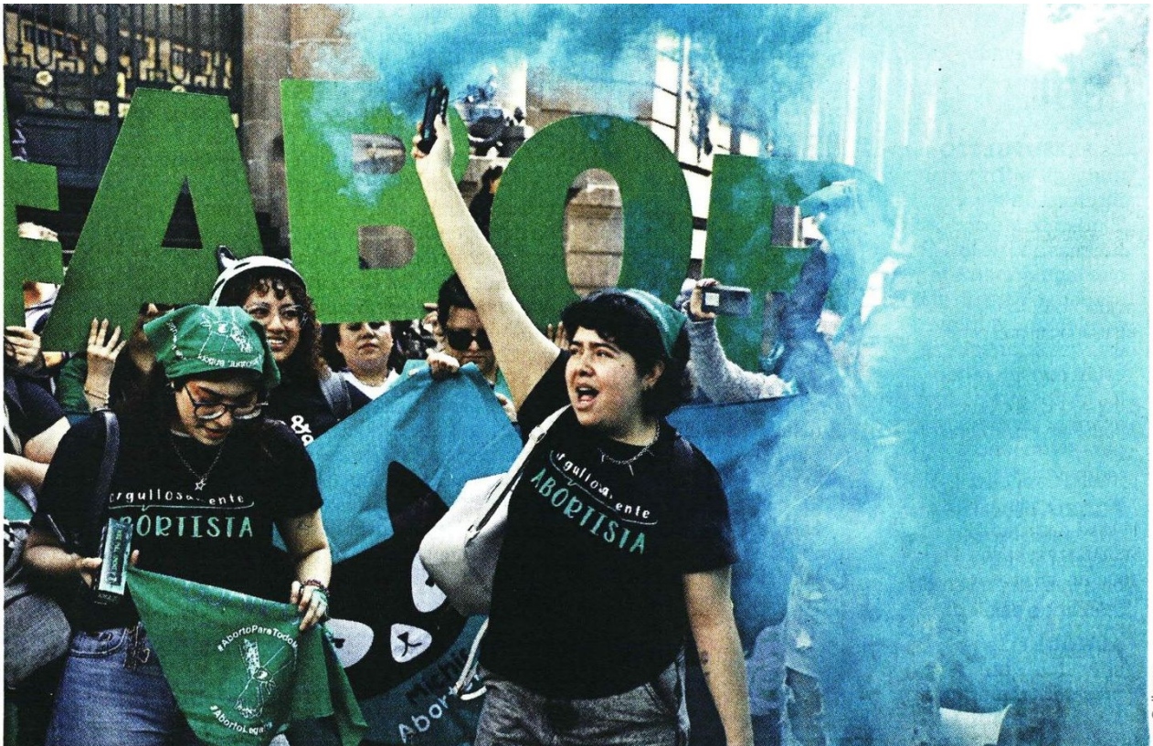
DE ACOMPAÑAR A RECLAMAR. Desde hace varios días colectivos habían convocado a movilizarse en Donceles, con el objetivo de cobijar la aprobación de la reforma. Ante la pausa legislativa, las concentraciones tuvieron un tono de protesta.