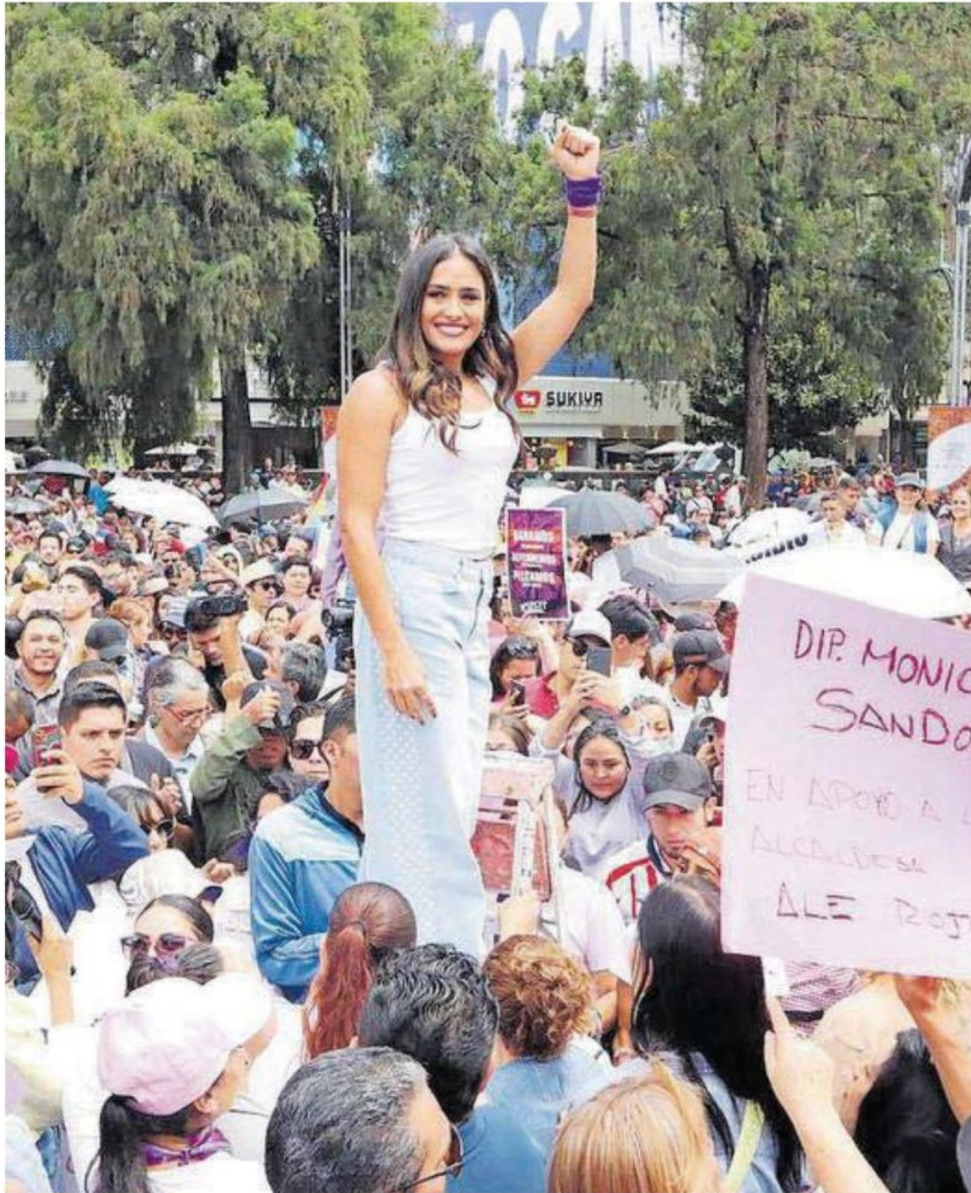
Ante cientos de simpatizantes en la glorieta de la Diana, la alcaldesa electa de la Cuauhtémoc, reafirmó su compromiso de defender su triunfo del 2 de junio.