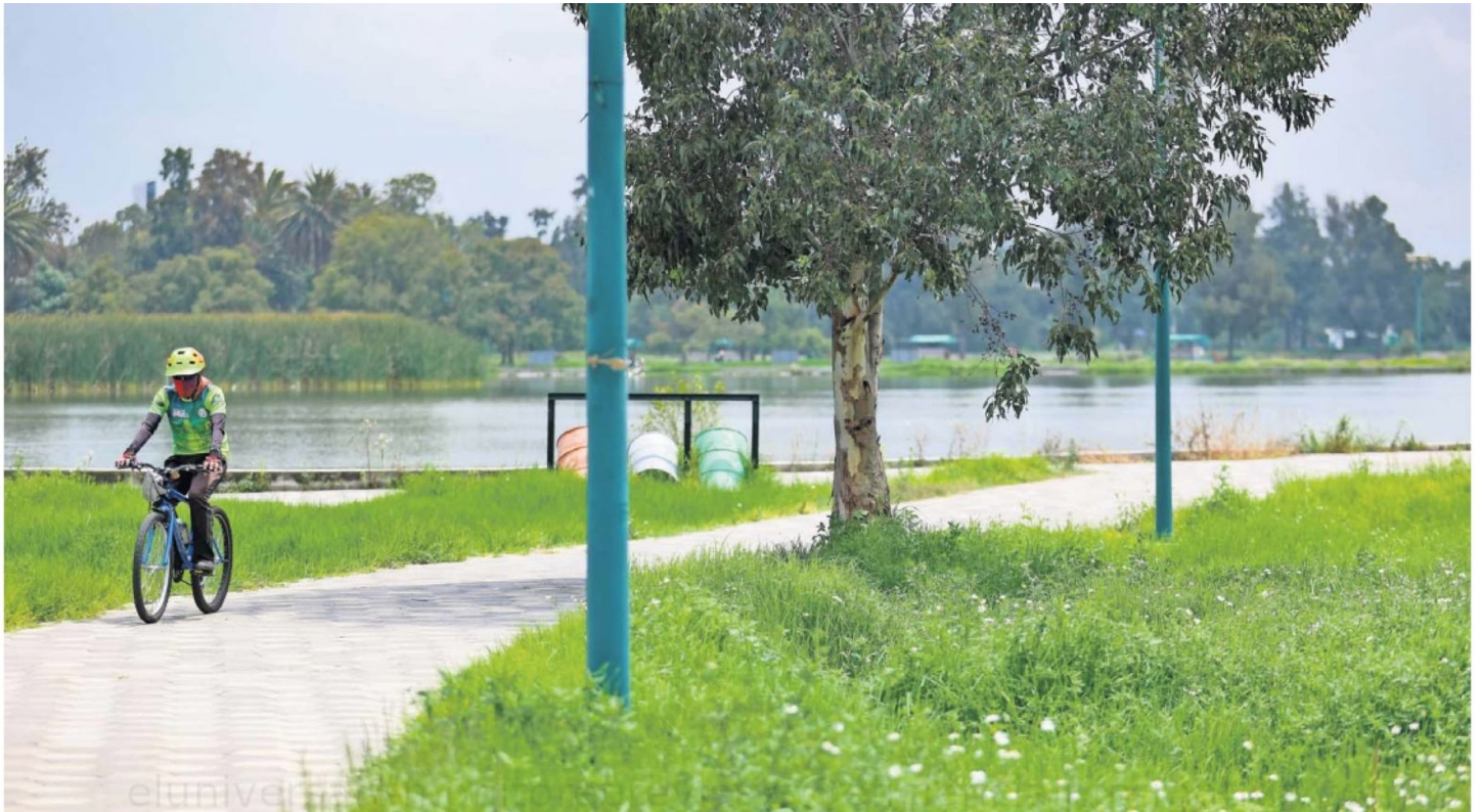
El Bosque de San Juan de Aragón, ubicado en la alcaldía Gustavo A. Madero, es uno de los 17 parques rehabilitados en lo que va de la actual administración.

en la Ciudad son árboles y 70% otro tipo de vegetación.