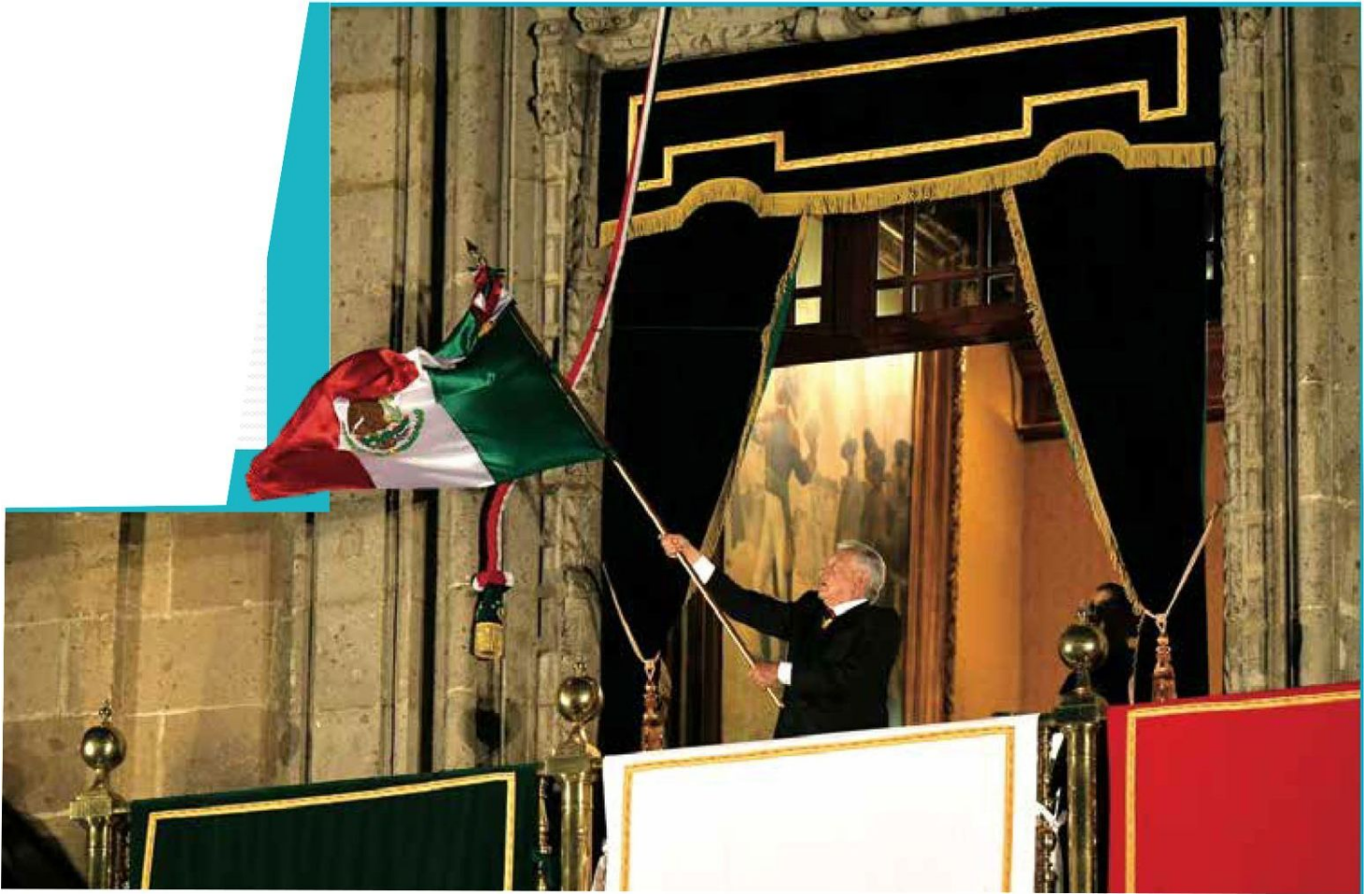
FESTEJO. El presidente López Obrador, junto a Beatriz Gutiérrez, su esposa, encabezó su última celebración de El Grito.