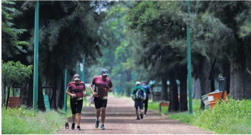
Todos los días en el Bosque de San Juan de Aragón decenas de personas disfrutan de las áreas verdes para ejercitarse o pasear a sus perros.