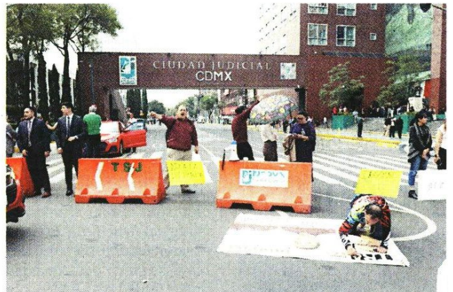
■ Además de no permitir el acceso, en la Ciudad Judicial se organizó un bloqueo sobre Avenida Niños Héroes.