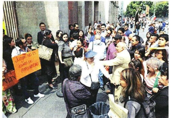
■ Protestas y paro contra la reforma judicial en los juzgados familiares que están frente a la Alameda Central.

En el acuerdo se refirió a los inconformes sólo como “personas” que impidieron el acceso a las instalaciones de usuarios y trabajadores.