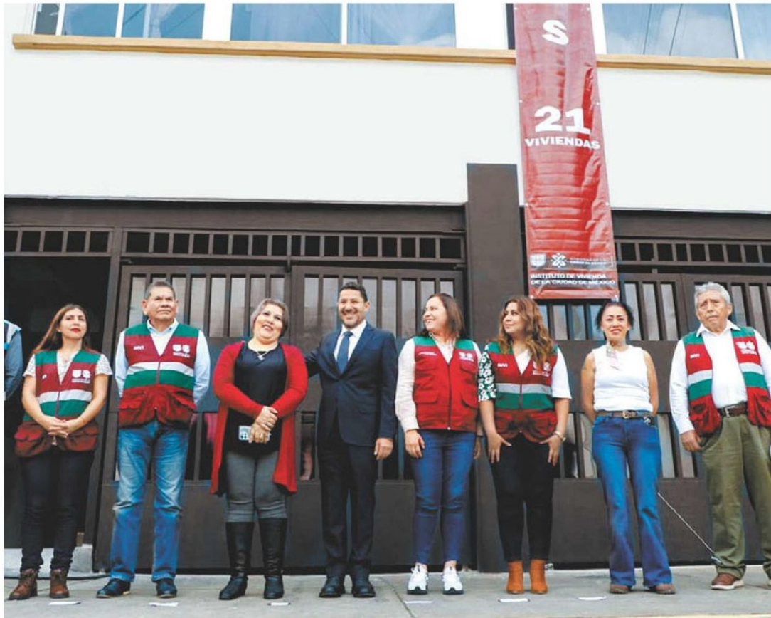
El mandatario entregó un conjunto habitacional en la alcaldía Benito Juárez.