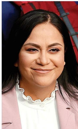
ARIADNA MONTIEL SECRETARIA DE BIENESTAR