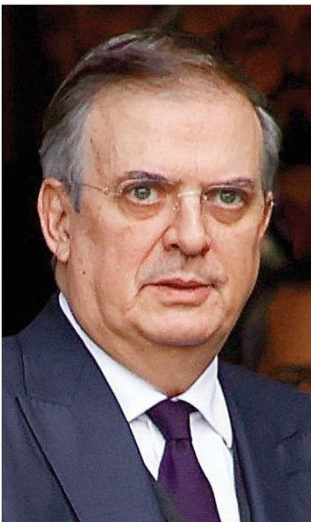
MARCELO EBRARD SECRETARIO DE ECONOMÍA

Tras rendir protesta en el pleno, Clara Brugada salió a las escalinatas del Congreso de la Ciudad de México acompañada por la Presidenta, Claudia Sheinbaum.