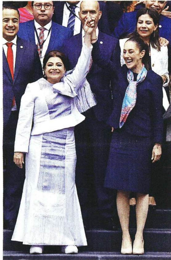
La Presidenta Claudia Sheinbaum acompañó a la nueva Jefa de Gobierno en su toma de protesta.