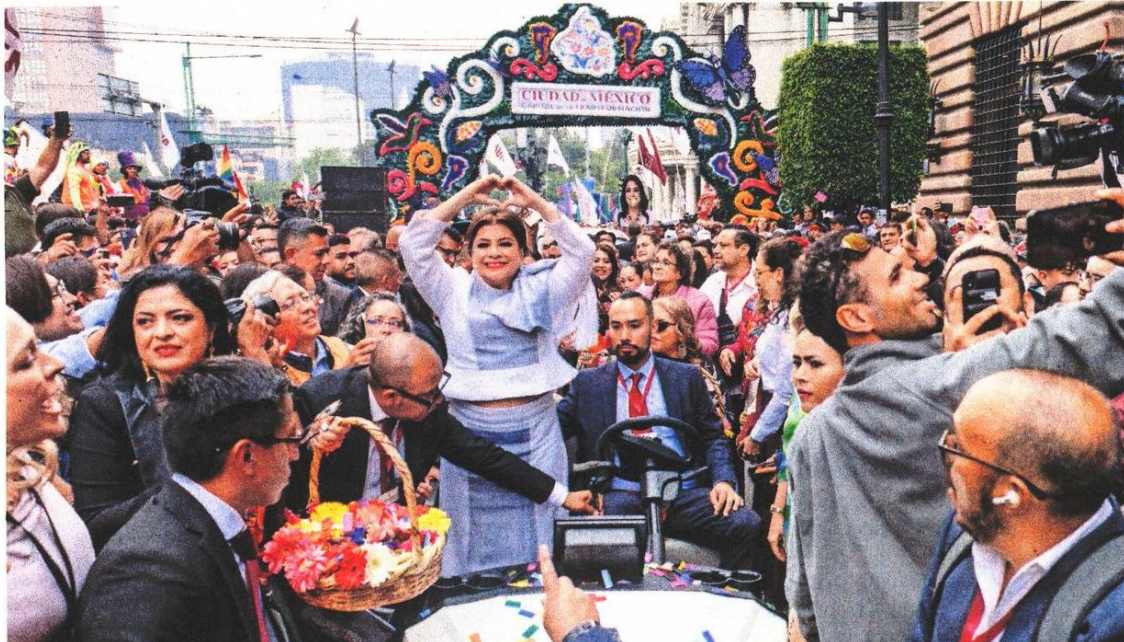
La jefa de Gobierno encabezó, a bordo de un carro de golf, la Caravana de la Capital de la Transformación, que inició en el Eje Central y 5 de Mayo hacia el Zócalo, donde la esperaban representantes de pueblos originarios.