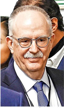
JULIO BERDEGUÉ SECRETARIO DE AGRICULTURA Y DESARROLLO RURAL