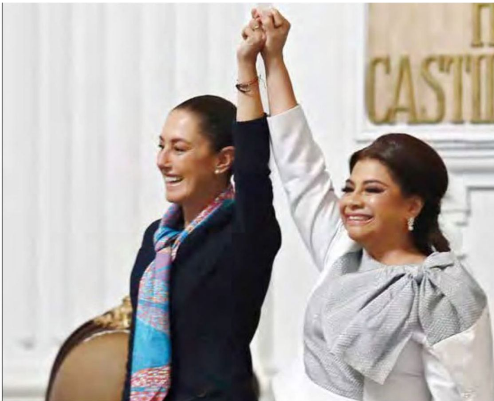
▲ La presidenta Claudia Sheinbaum acudió ayer a la toma de protesta de Clara Brugada en el Congreso de la Ciudad de México para el periodo 2024-2030. La nueva jefa de Gobierno reconoció

A. BOLAÑOS, S. HERNÁNDEZ Y R. GONZÁLEZ / P 23 Y 24