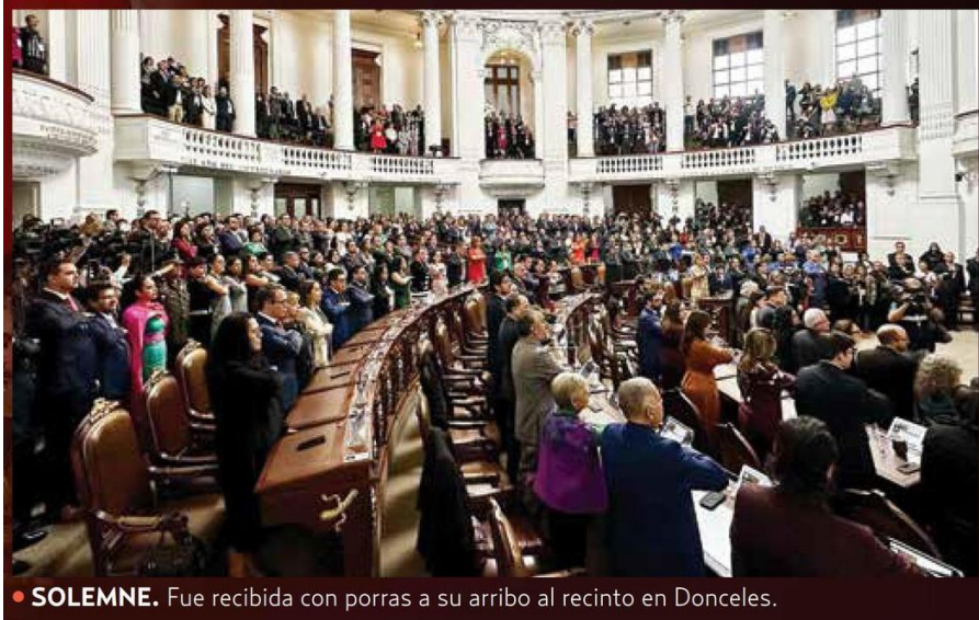
• SOLEMNE. Fue recibida con porras a su arribo al recinto en Donceles.