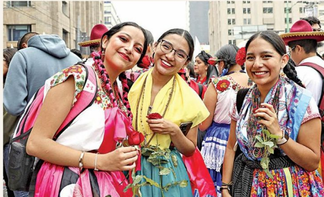
Cientos de simpatizantes aguardaron en Eje Central y calle 5 de Mayo para saludar a Brugada en su camino al Zócalo.