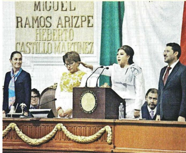
■ Brugada estuvo acompañada por la Presidenta Claudia Sheinbaum y el ex Jefe de Gobierno, Martí Batres.