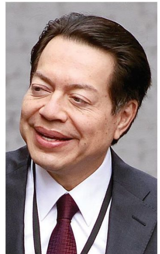
MARIO DELGADO SECRETARIO DE EDUCACIÓN PÚBLICA