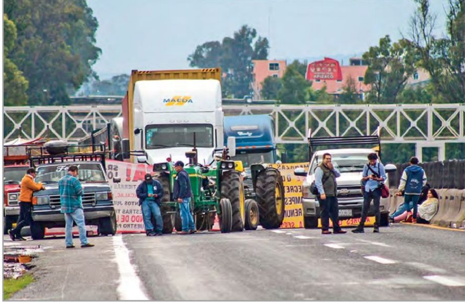
LLAMADO. Empresarios llamaron a las autoridades a liberar la vía, pues se afecta el derecho de terceros.