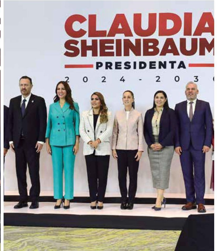
BLOQUES | • Mandatarios de occidente, bajo y del centro del país llevaron sus peticiones a la virtual presidenta, Claudia Sheinbaum.