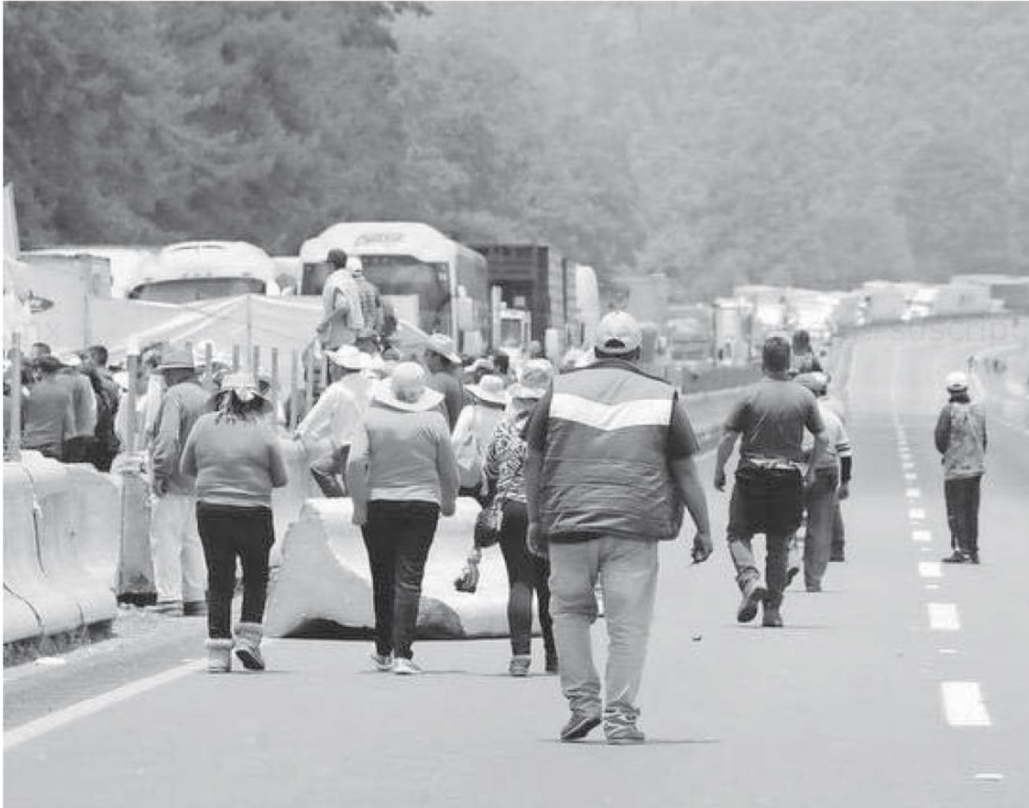
Personas afectadas caminan sobre la carretera bloqueada