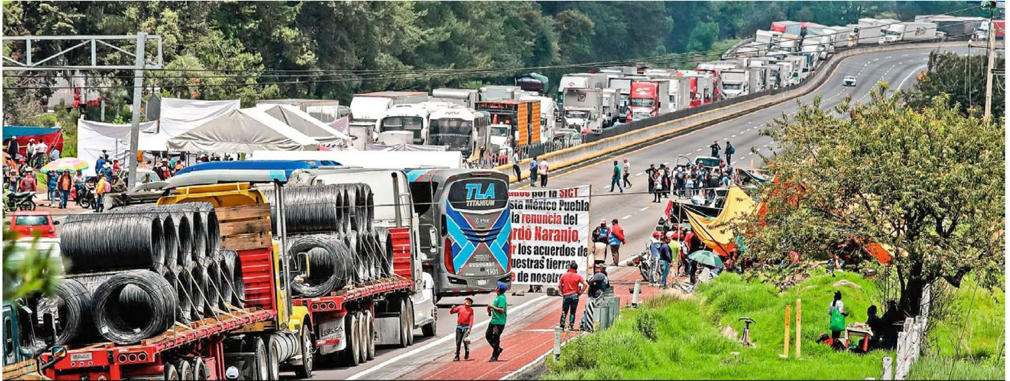
PRISIÓN DE ASFALTO. Automovilistas atrapados en el bloqueo de la autopista México-Puebla cumplen casi dos días sin poder salir de la vía, por una protesta de ejidatarios PÁGINA 2