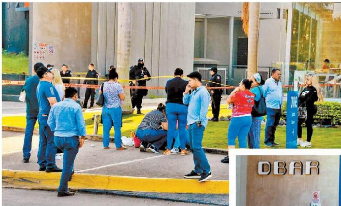
La agresión, en la zona Tabasco 2000.