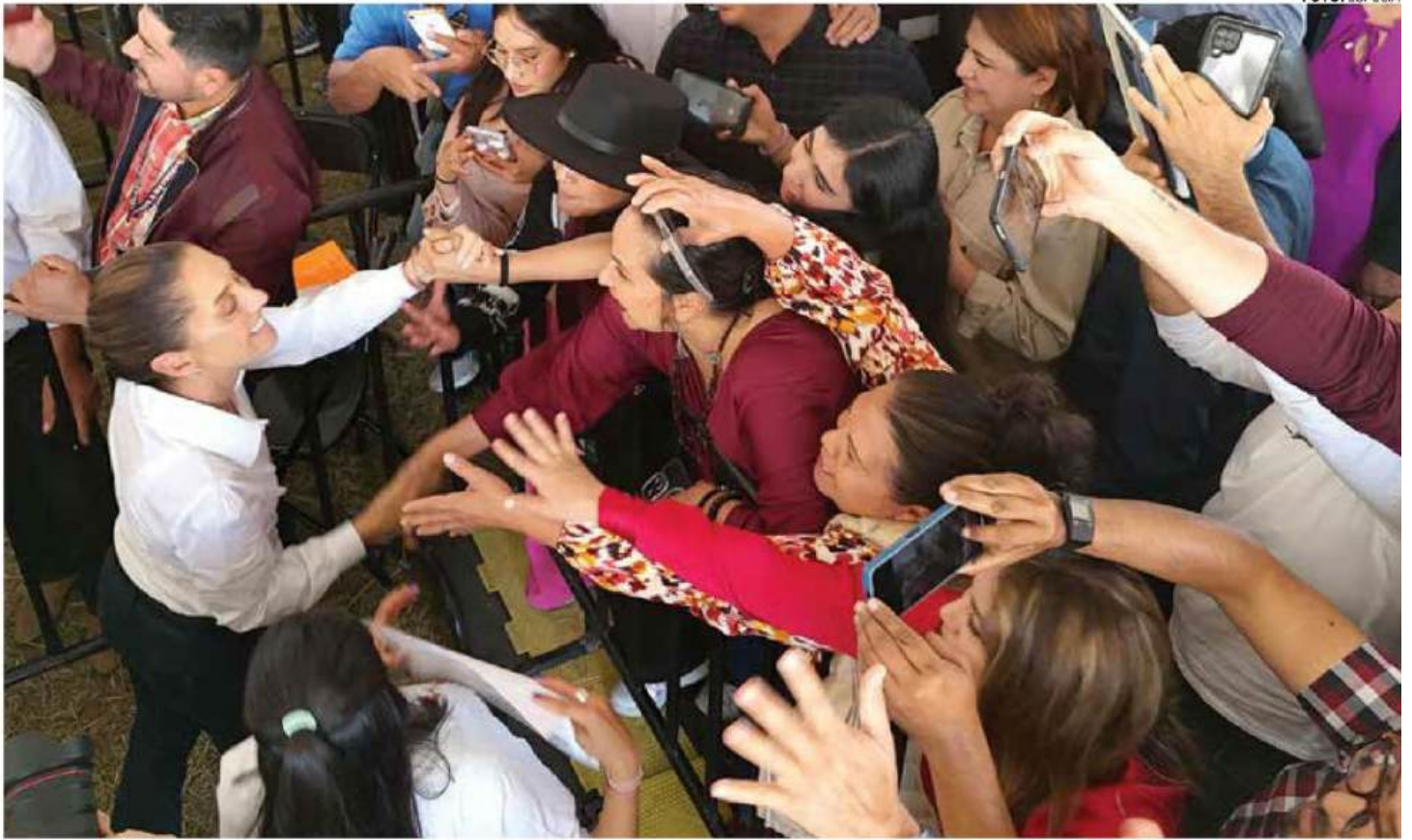
• RECEPCIÓN. La Presidenta durante su arribo a tierras michoacanas, donde hizo importantes anuncios sobre programas sociales.