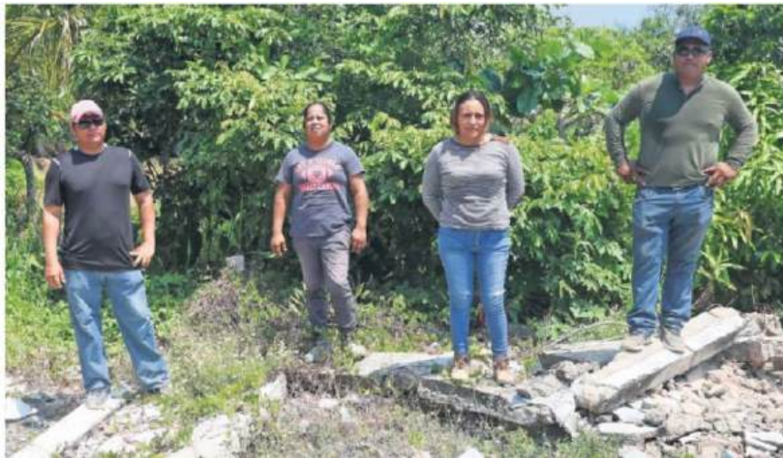
La familia Hernández llevaba casi tres décadas viviendo a un costado de la línea Z del Ferrocarril en Coatzacoalcos. El gobierno demolió su casa con la reactivación del Interoceánico.

En San Mateo del Mar, Oaxaca, el mar se ha tragado parte de la colonia Cuauhtémoc.