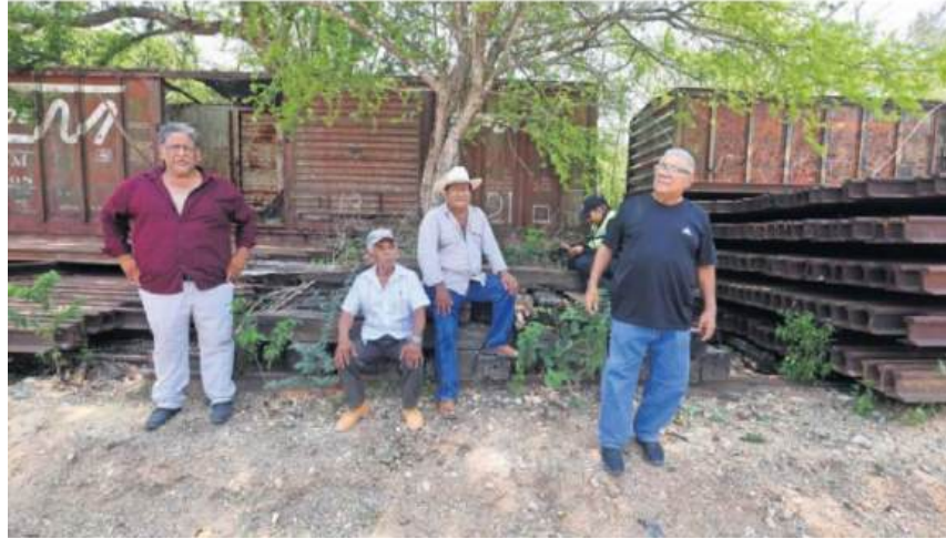
En Medias Aguas, Veracruz, confiaban en que el gobierno pagara un precio justo por el terreno que está utilizando para el ferrocarril, pero la oferta fue de 27 centavos por metro cuadrado.