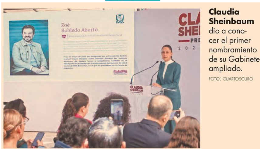
Claudia Sheinbaum dio a conocer el primer nombramiento de su Gabinete ampliado.

Claudia Sheinbaum informó que se reunirá, en agosto próximo, junto a todo el próximo Gabinete, a excepción de la Sedena y de Semar, durante tres o cuatro días, para trabajar, planear y desarrollar acciones.