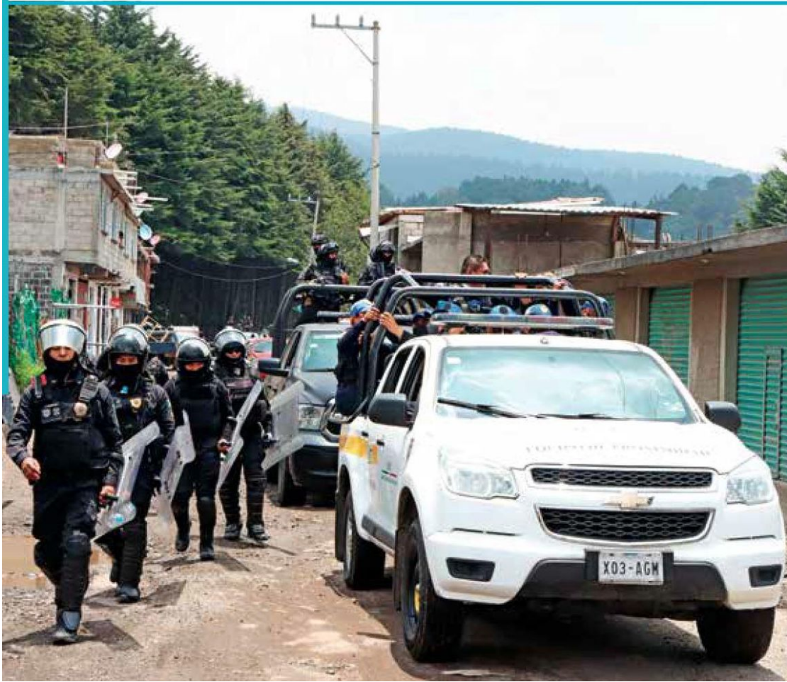
LLAMADO. Las autoridades han solicitado apoyo de la ciudadanía para presentar denuncias.