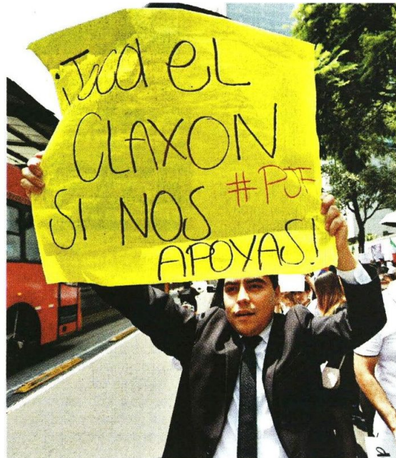
Personal del CJF solicitó el apoyo de automovilistas a su movilización para exigir respeto a sus derechos.