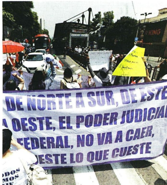
Trabajadores se manifestaron frente a la sede del CJF para defender el sistema de impartición de justicia.

También por el Instituto Tecnológico Autónomo de México (ITAM), el Instituto Tecnológico de Estudios Superiores de Monterrey (ITESM) y el Centro de Investigación y Docencia Económicas (CIDE).