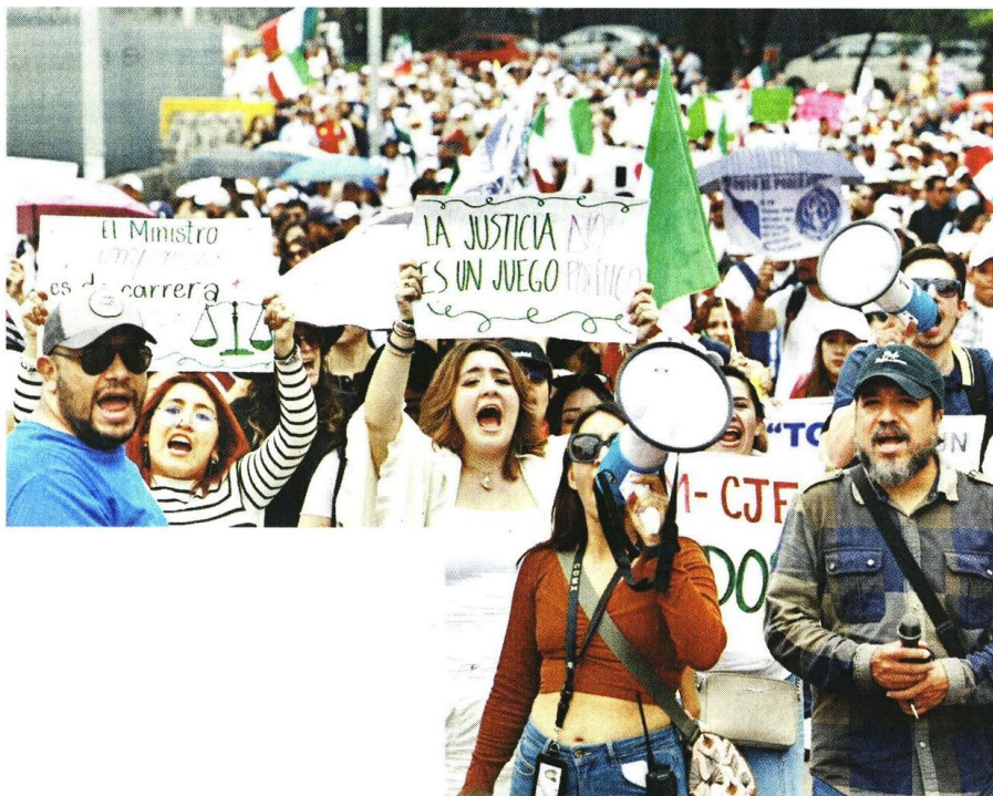
Los jóvenes acusaron que la reforma les bloquea su derecho a realizar una carrera judicial independiente.