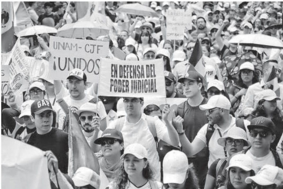
Los estudiantes y profesores salieron de la Facultad de Derecho en Ciudad Universitaria