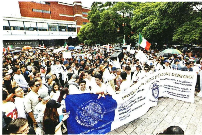
La movilización estudiantil en defensa del Poder Judicial partió de la Facultad de Derecho, en Ciudad Universitaria.