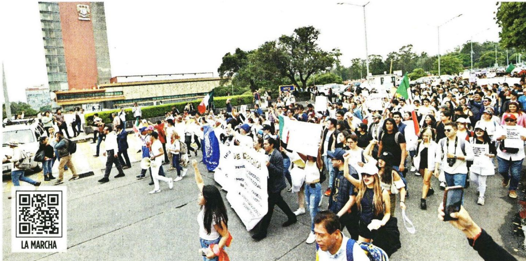
Estudiantes de diversas carreras exigieron a la Rectoría de la UNAM un pronunciamiento sobre la reforma judicial.