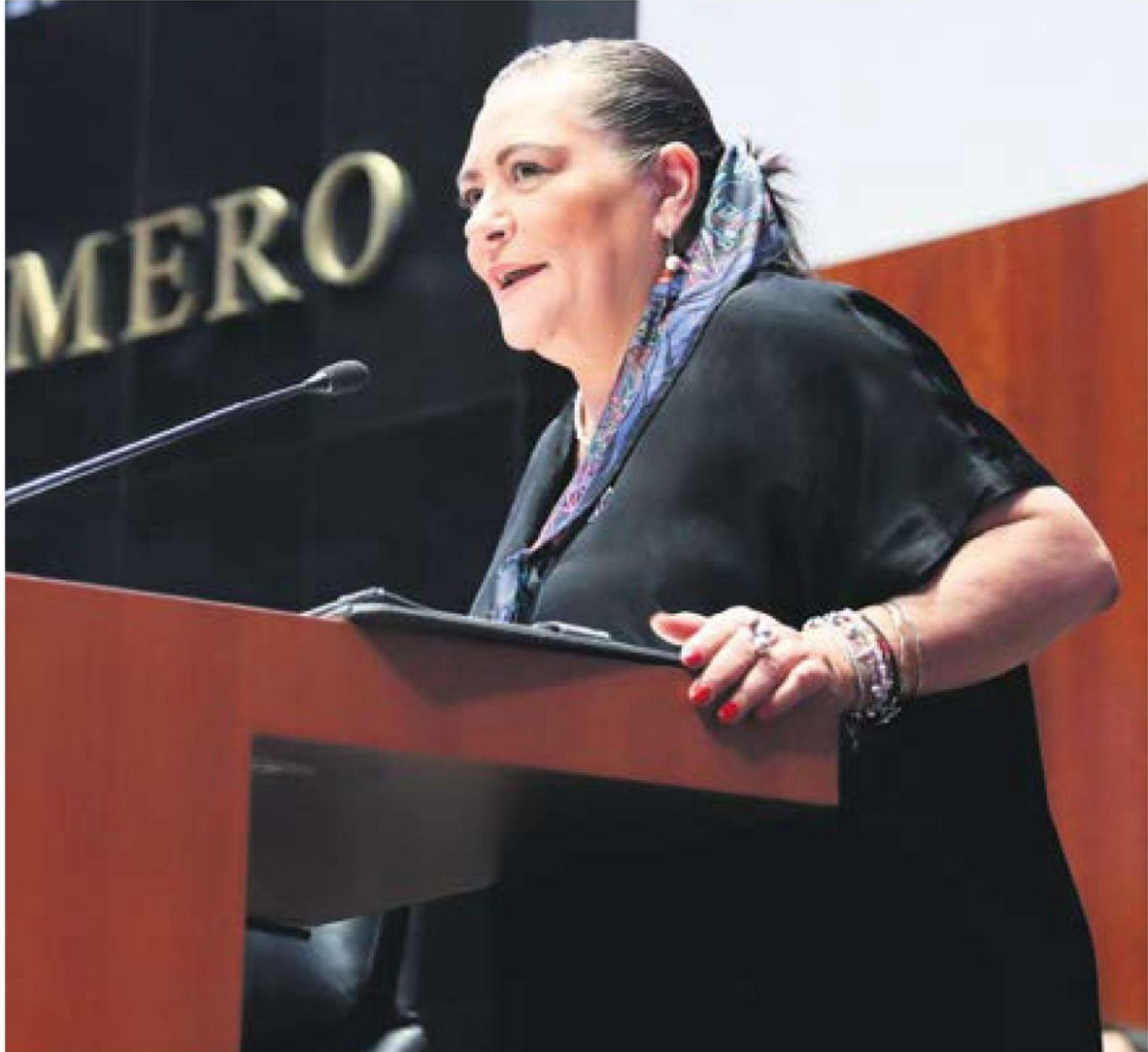
Mensaje. Guadalupe Taddei, consejera presidenta del INE, en el Senado.