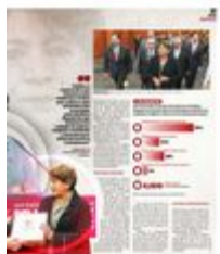
Delfina Gómez hizo historia al convertirse en la primera mujer gobernadora del Estado de México.