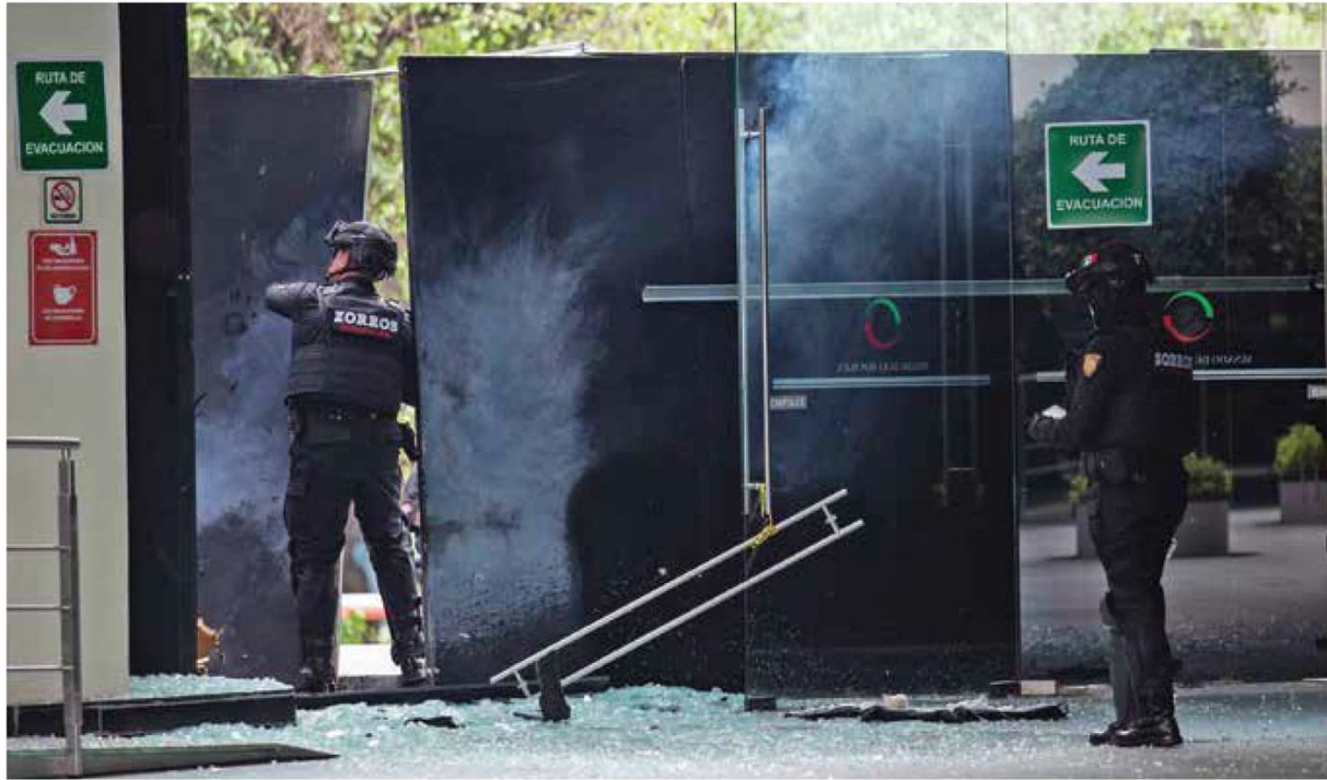
PROTESTAS. Pese a que el recinto legislativo se convirtió en un búnker, manifestantes lanzaron petardos.