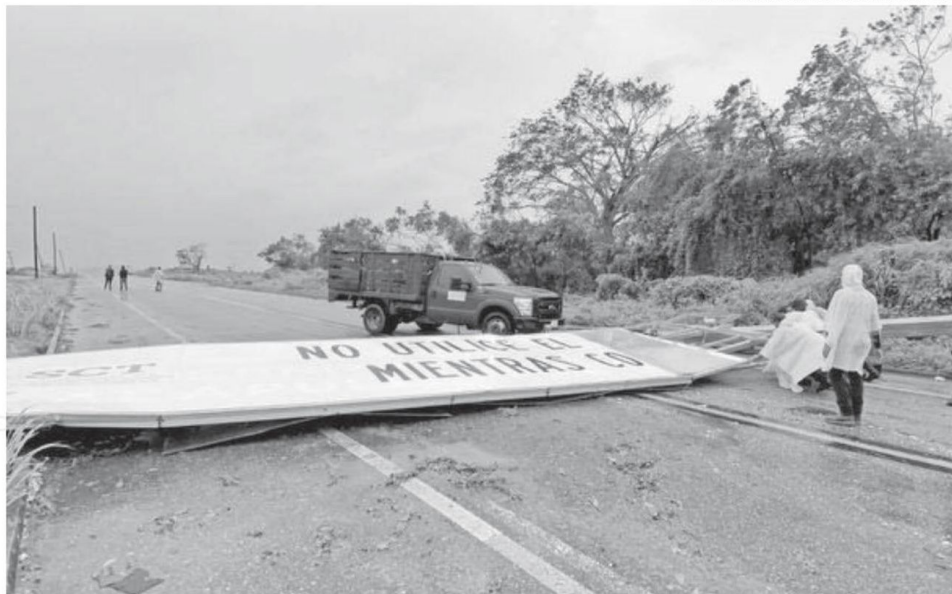
Caída de señalamiento vial en un tramo carretero del municipio de San Marcos, Guerrero