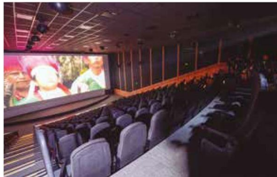
Estreno. Una línea de Cablebús y un cine son parte del nuevo proyecto en Chapultepec.