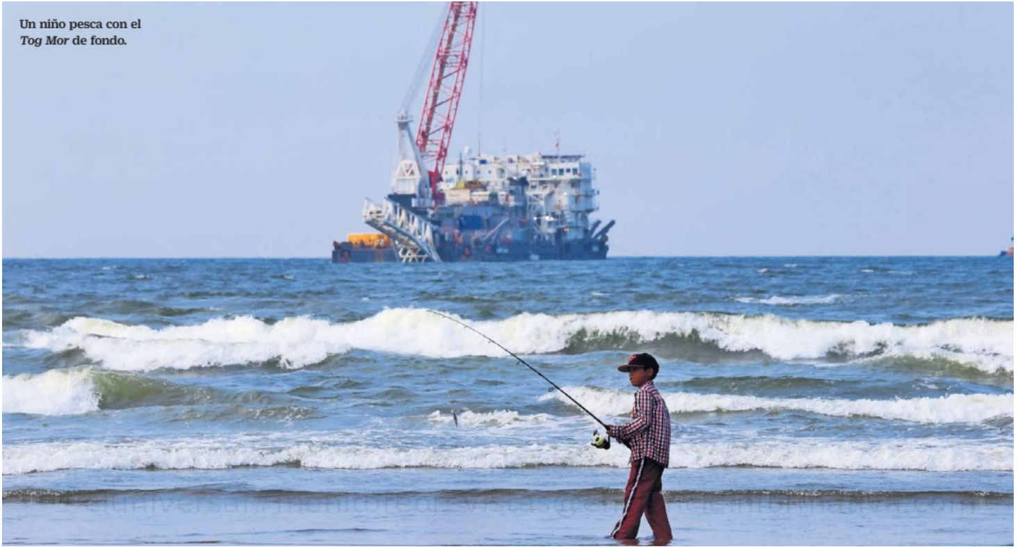
Un niño pesca con el Tog Mor de fondo.