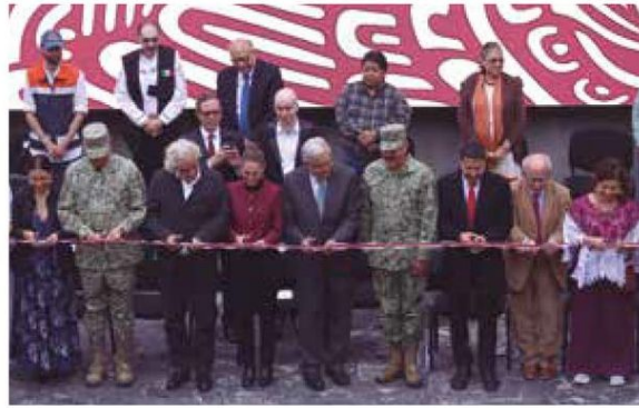
Inicio. Claudia Sheinbaum y López Obrador cortaron el listón.