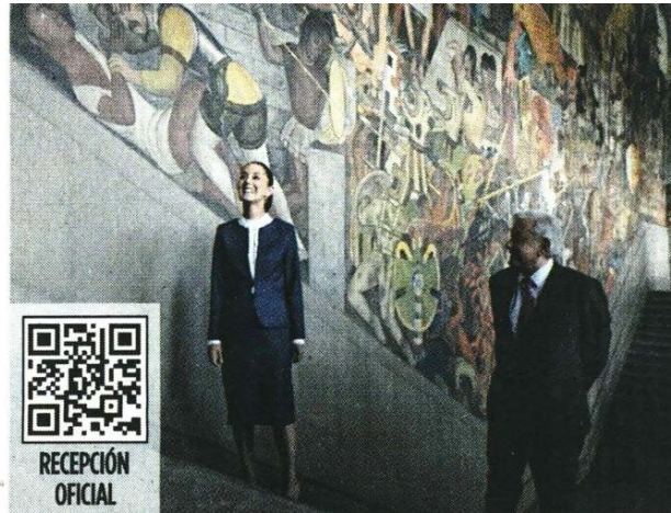
■ Sheinbaum y López Obrador admiran los murales en el interior del recinto.

“Fue muy interesante y emotivo conversar con la virtual Presidenta electa de México, Claudia Sheinbaum Pardo. Somos amigos y junto a millones de compañeras y compañeros, desde abajo y entre todos, iniciamos la Cuarta Transformación en bien de nuestro amado pueblo”, posteó más tarde Lopez Obrador en su cuenta de X.