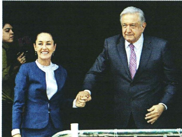
■ Claudia Sheinbaum y Andrés Manuel López Obrador se reunieron ayer en Palacio Nacional.

El peso se ha desplomado más de 8 por ciento después de que la coalición liderada por Morena tuvo un desempeño mejor de lo esperado en las elecciones para el Congreso.