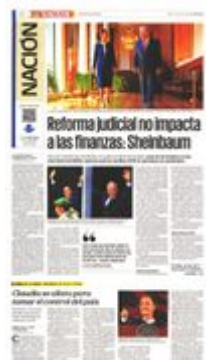
La virtual presidenta electa, Claudia Sheinbaum, y el mandatario federal en funciones, Andrés Manuel López Obrador, recorrieron varios pasillos de Palacio Nacional.