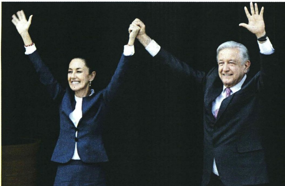
LA SEÑAL. La Presidenta electa y el Mandatario en funciones saludan a simpatizantes antes de ingresar a Palacio Nacional.