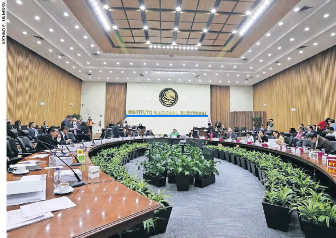
Los informes de Fiscalización del INE indican que el PAN y PRD capitalinos fueron los únicos en incumplir con la entrega de recursos para las campañas de sus candidatas.