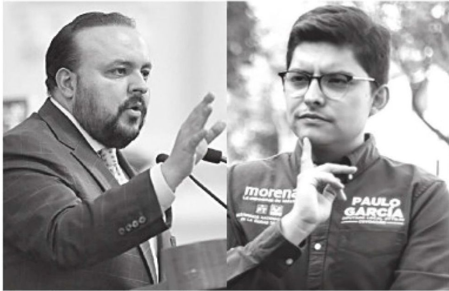
- Tras reafirmar resultados electorales .