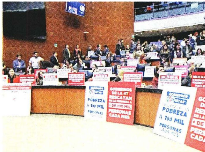
La Presidenta respaldó la reforma para que los programas del Bienestar sean derecho constitucional.