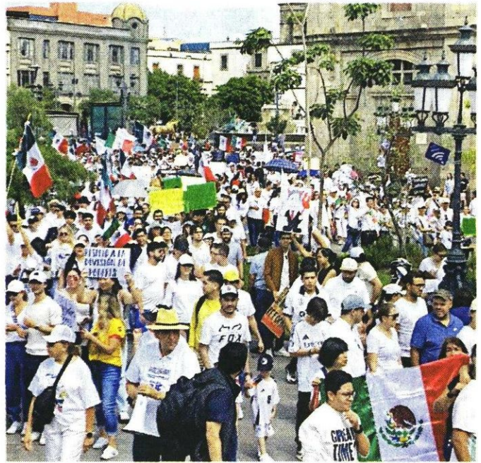
La Presidenta ha mantenido la confrontación con juzgadores y trabajadores del Poder Judicial opositores a la reforma.