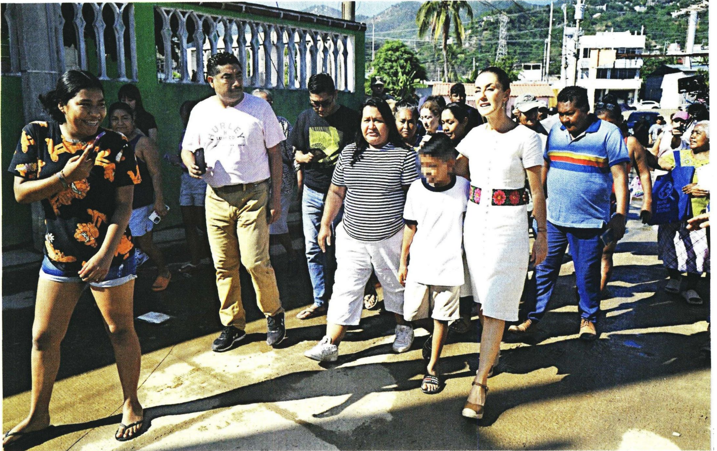
RECONSTRUCCIÓN. La Presidenta Claudia Sheinbaum en Acapulco, donde encabezó el 27 de octubre la presentación de un informe sobre las acciones emprendidas para atender los daños causados por el huracán "John".