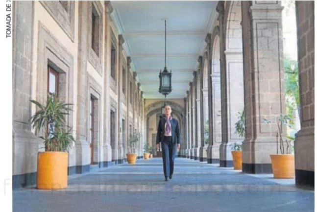
A través de sus redes sociales, Claudia Sheinbaum compartió esta imagen en Palacio Nacional, el cual está por habitar próximamente.

“Palacio Nacional tiene su propio presupuesto para conservar esto que es un monumento histórico de todos los mexicanos”