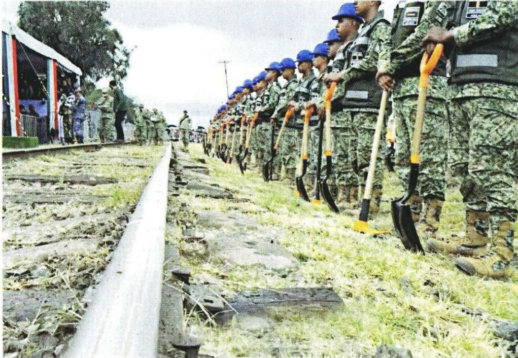
■ El 6 de octubre, en Tizayuca, Hidalgo, se dio el banderazo a los trabajos preliminares del tren México-Pachuca, que estará a cargo de la Defensa Nacional.