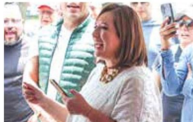
Apoyo. Xóchitl Gálvez visitó a trabajadores del Poder Judicial.