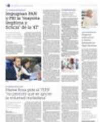
Queja. Marko Cortés, presidente del PAN, el pasado sábado.