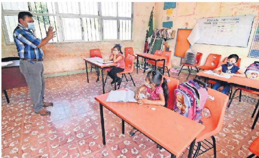
Un maestro de educación básica de una escuela pública gana entre 13 mil y de 16 mil pesos mensuales, aún así debe "mocharse" con la cuota a los delincuentes.

Autoridades revelan que de 2019 a mayo de 2024 maestros y maestras han denunciado a delincuentes que les exigen derecho de piso a cambio de que no los agredan o perjudiquen a sus familiares; existen 91 carpetas iniciadas por este delito.