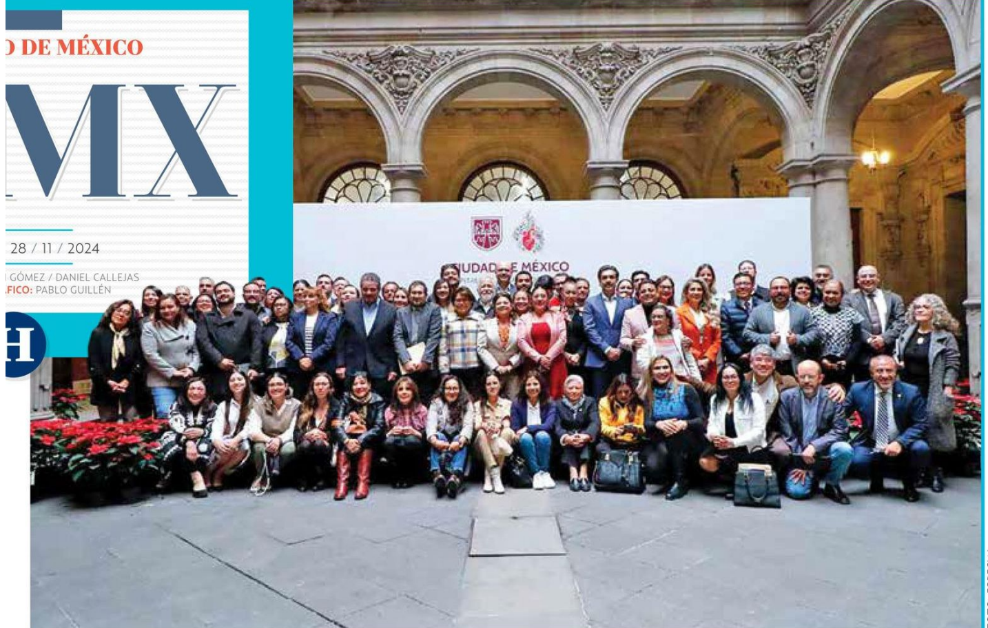
• UNIÓN. La mandataria capitalina, parte de su gabinete y legisladores, ayer, en el Antiguo Palacio del Ayuntamiento.