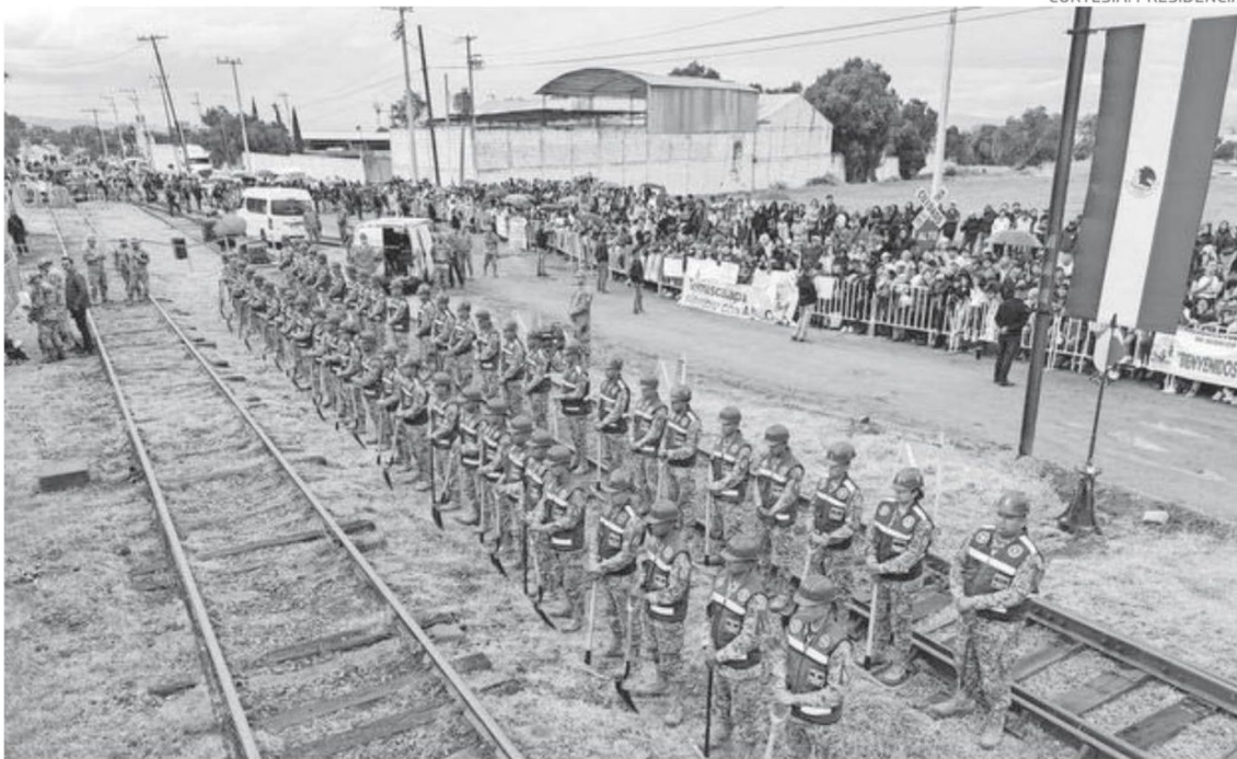
La construcción del tren inicia en la antigua estación de Huitzila