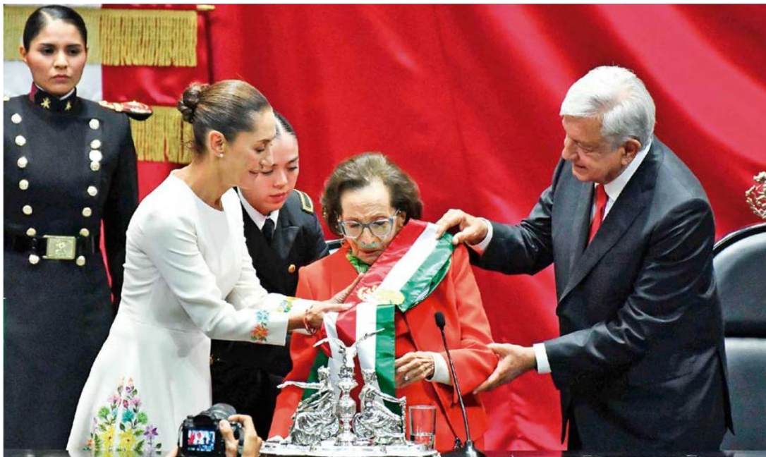
GRAN DESPEDIDA. El último acto público de su larga carrera política fue entregarle a la Presidenta la Banda Presidencial.