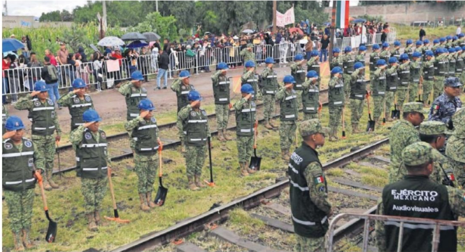
Claudia Sheinbaum asiste al inicio de las obras del Tren del Norte en Huitzila, Hidalgo.