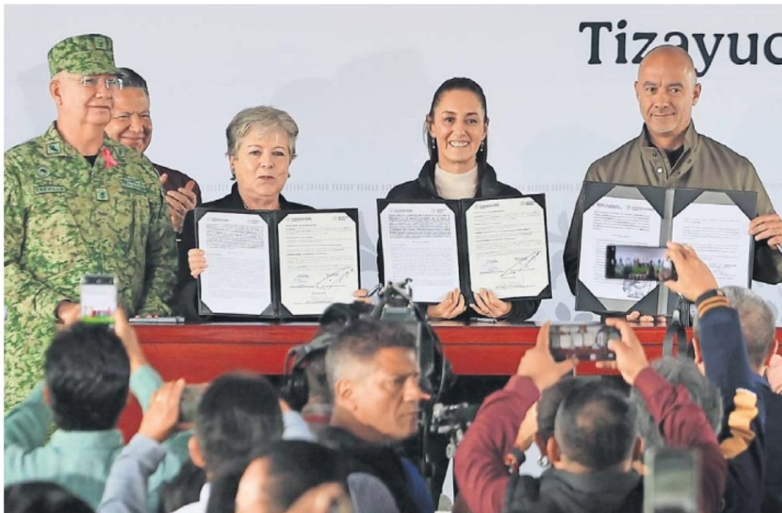
La presidenta Claudia Sheinbaum fue testigo del convenio de inicio de los estudios preliminares para la construcción del tren México-Pachuca, en la antigua estación del ferrocarril en Huitzila, Hidalgo.