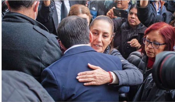
PRESENTE. La Presidenta de México acudió al velorio a dar su pésame.