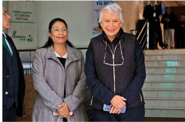
DIPUTADA. La exministra Olga Sánchez Cordero, hoy legisladora federal por Morena, acudió temprano.