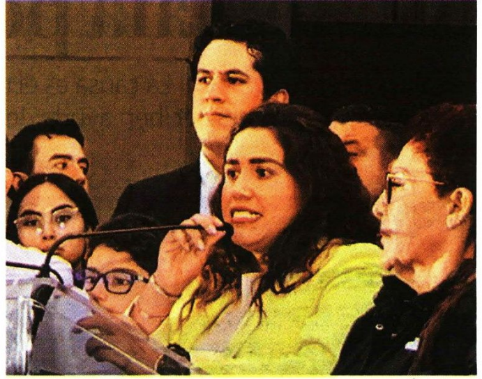
La alcaldesa electa en el Senado y la ex candidata durante su concentración en la explanada de la alcaldía.