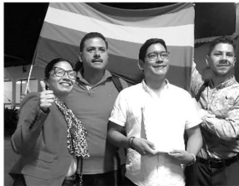
· Legislación es poco exigente en la materia

· En un informe que al respecto presentó la asociación Yaaj, se advierte que este fenómeno se debe a la poca exigencia de la ley para acreditar una auténtica identidad de género