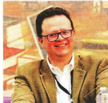
EL MAGISTRADO Felipe de la Mata, autor de la novela, en imagen de archivo.

Las heridas retrata también el primer amor, la reconciliación y la esperanza, así como un país violento y a la vez inocente. Es una novela coming of age , es decir, que retrata una etapa de crecimiento tanto de sus personajes como del país y todas las emociones que esto conlleva: dolor, gozo, ilusión y esperanza y confusión.