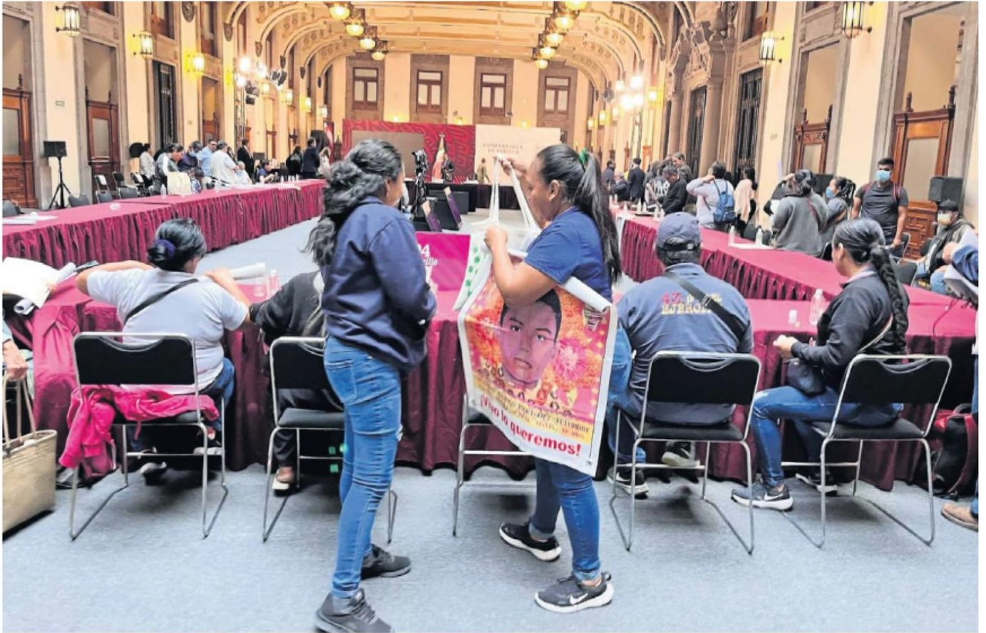
Los padres de los 43 consideraron que "no tiene caso" confrontarse con el Presidente cuando no hay resultados en el caso.