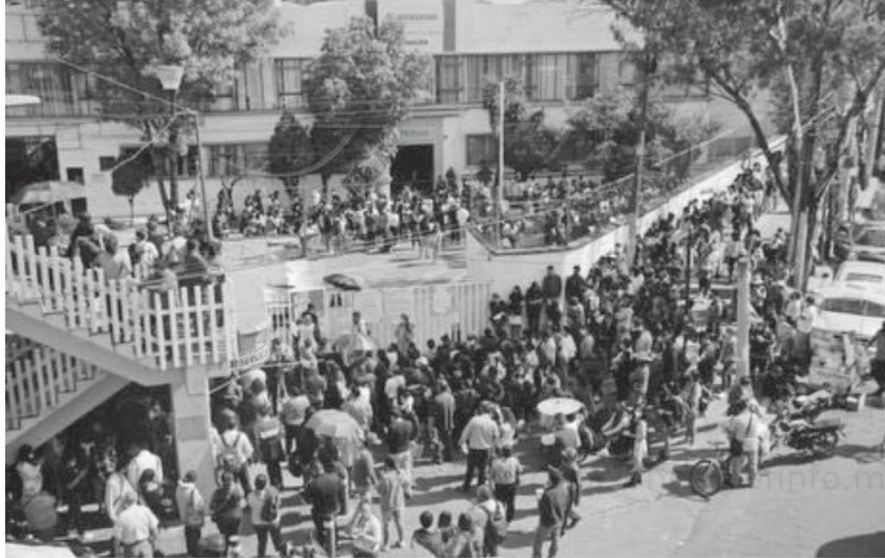
La evaluación de la política social es parte de las tareas del Coneval