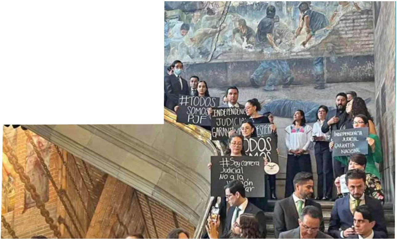
• PACÍFICA. Trabajadores de la Suprema Corte de Justicia se manifestaron en los pasillos del máximo tribunal federal para protestar contra la Reforma Judicial.