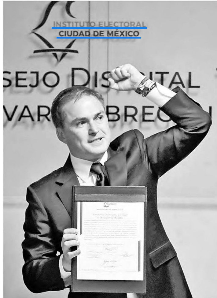
◀ El alcalde electo, quien en la gráfica muestra su constancia de mayoría, podría haber gastado más dinero de lo establecido en la ley.