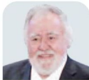
Alejandro Encinas Rodríguez Secretario de Planeación y Ordenamiento Territorial

La Jefa de Gobierno, Clara Brugada Molina, ya nombró a las personas que ocuparán los cargos en las nuevas secretarías capitalinas.