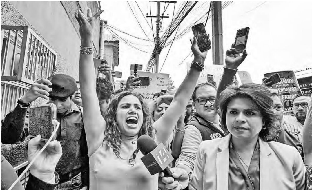
► Seguidores de Rojo de la Vega increparon a la morenista (al centro) por la cancelación de las elecciones .