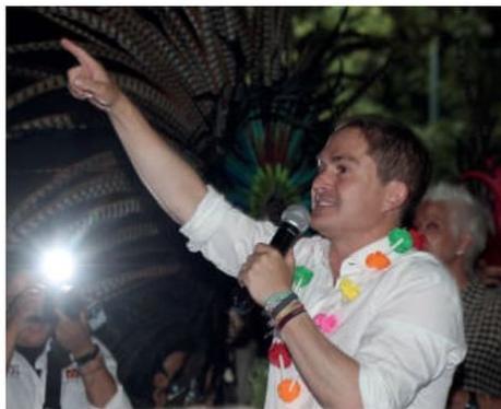
López Casarín rebasó por más del 6% el tope de campaña.