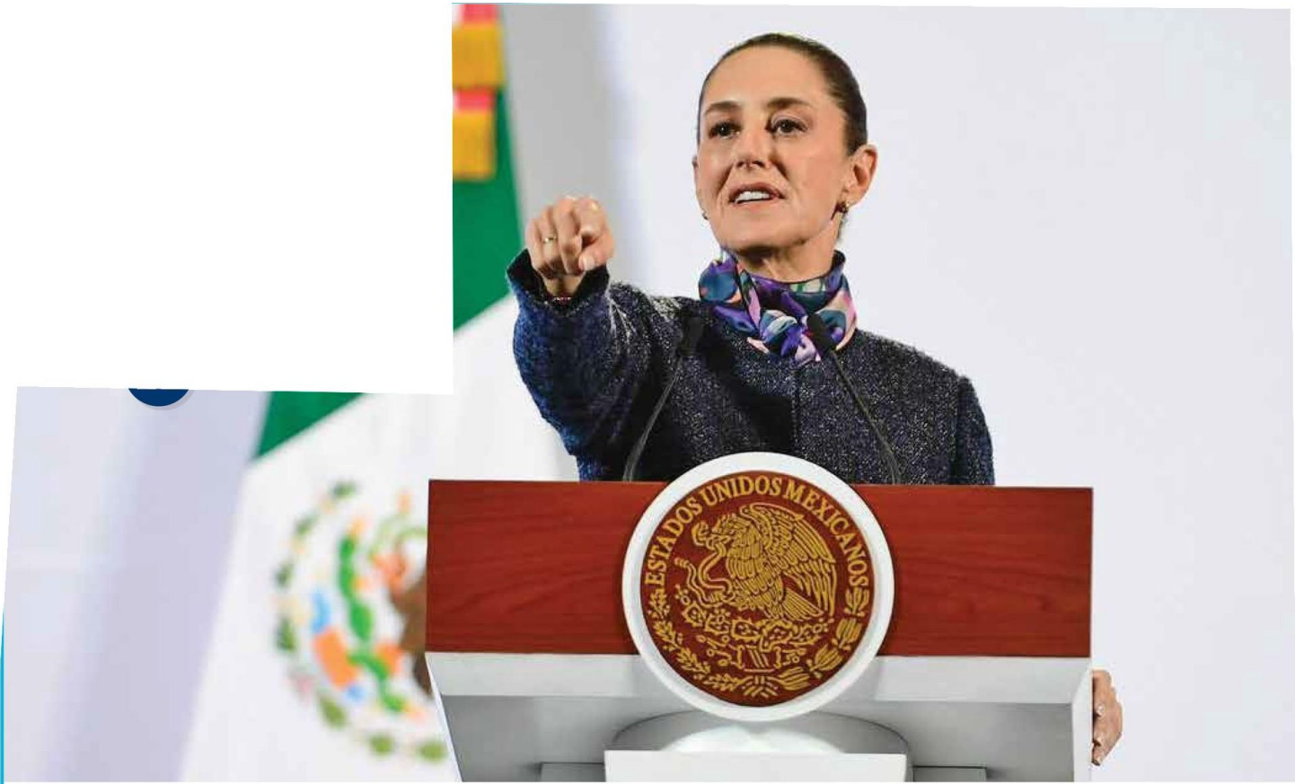
• DETALLES. La Presidenta de México se refirió a la llamada que tuvo con el presidente electo de Estados Unidos, durante su conferencia mañanera .