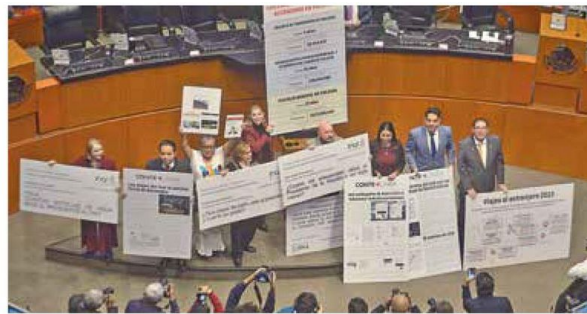
Extinción. Pese a reclamos y al morenista Javier Corral, que votó en contra.