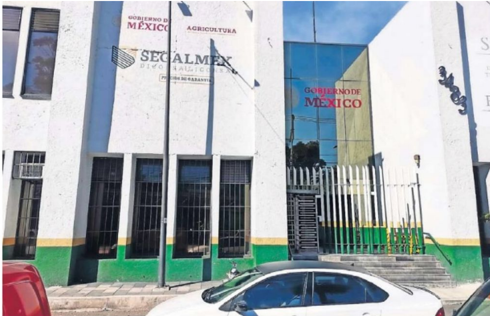
En febrero de 2022, Segalmex se vio envuelto en un escándalo de fraude por 15 mil millones de pesos revelado por la Auditoría Superior de la Federación.

“Se detectaron diversas inconsistencias en los documentos que integran los 16 expedientes revisados de los contratos”