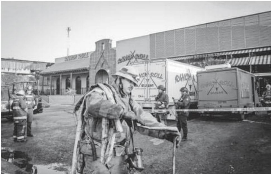
Bomberos laboraron en uno de los establecimientos afectados