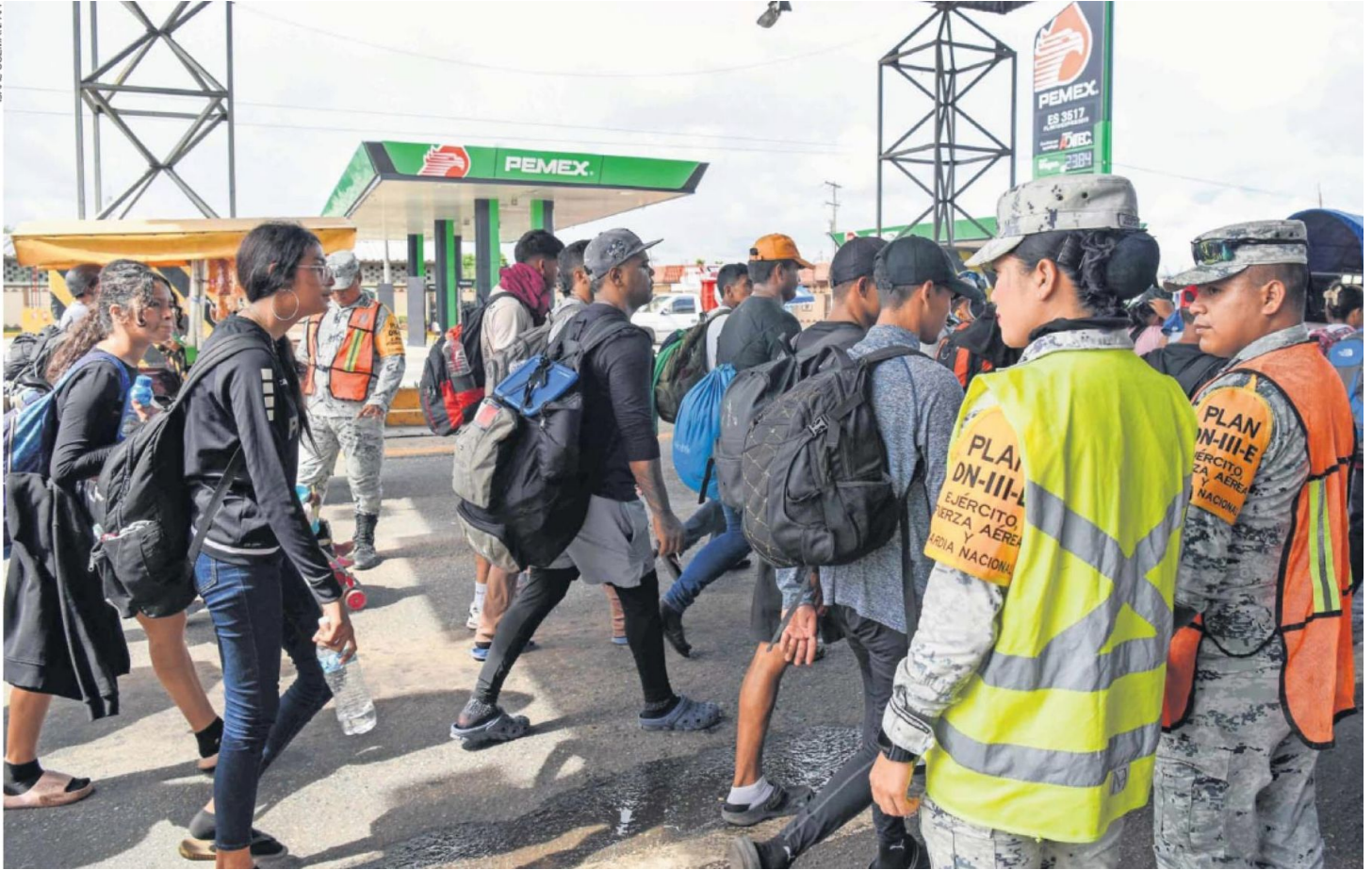
Miembros de la Guardia Nacional vigilan el paso de migrantes en Huehuetán, Chiapas, en su trayecto hacia la frontera norte.