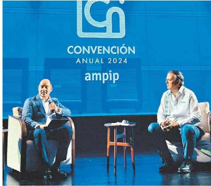
El secretario de Economía en foro de la IP. ESPECIAL