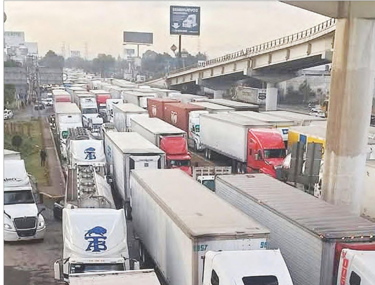
FILA DE VEHÍCULOS DE AL MENOS 40 KM

40 kilómetros. Foto La Jornada S. CHÁVEZ Y R. MONTOYA / P 25