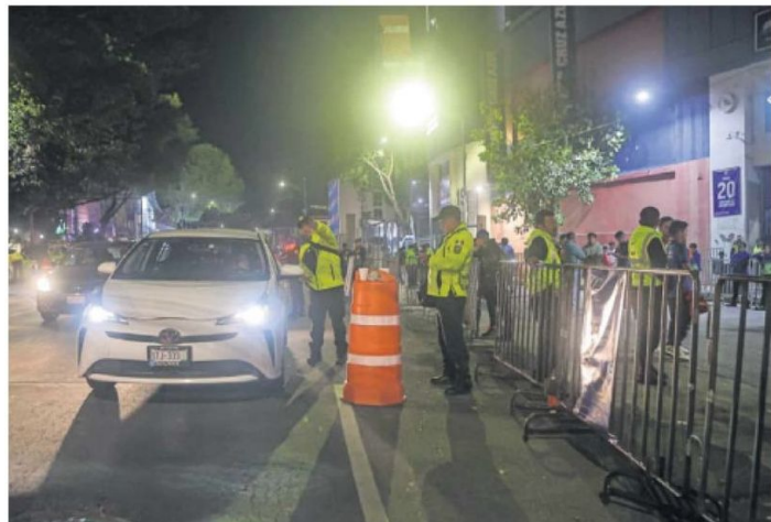
En las inmediaciones del Estadio Azul se desplegaron 100 policías preventivos, 100 de Tránsito y cerca de 20 patrullas en los alrededores.

Tras una reunión con empresarios, vecinos y autoridades del gobierno central y de la alcaldía, se aceptó la reapertura del Estadio Ciudad de los Deportes y la Plaza de Toros. El acuerdo fue: uso de pirotecnia conforme a las normas de Protección Civil, limpieza de las calles por parte de la alcaldía y garantizar la presencia y respuesta policial en la zona. ●