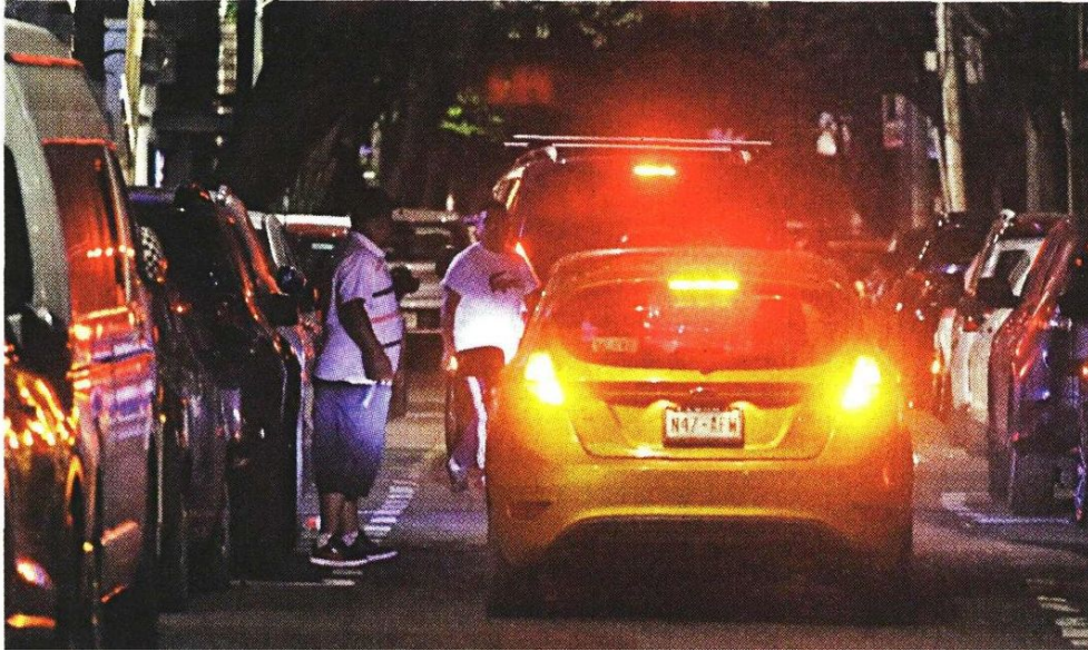
Pese al operativo, los vieneviene ofrecían lugares en calles de la Nápoles y la Noche Buena.