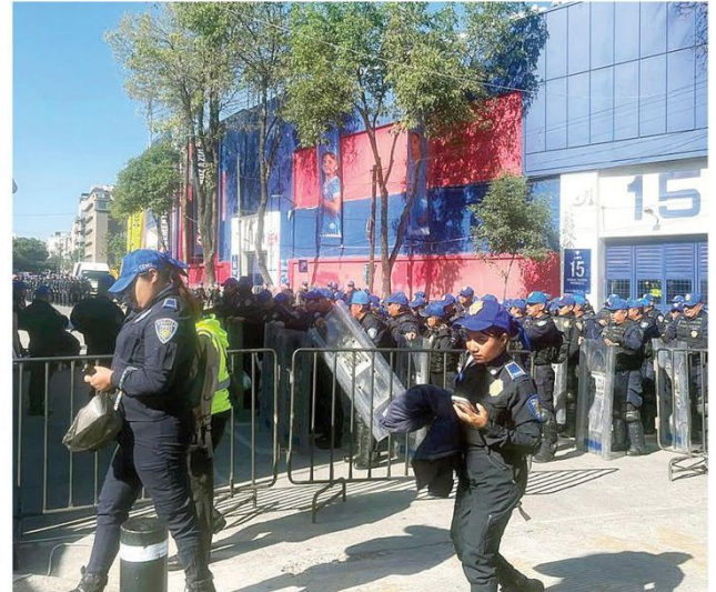
Más de mil 500 policías resguardaron las inmediaciones del estadio y la Plaza de Toros, que habían sido suspendidos.

Antes de que fuera suspendido el estadio, “en un operativo normal participábamos 700 elementos de la Auxiliar”, dijo a Excélsior un elemento de esta corporación que se encontraba en el sitio.