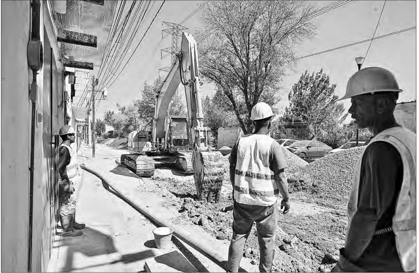
▲ Sólo siete trabajadores de una empresa subcontratada laboran a marchas forzadas para emparejar las calles, aunque los deslizamientos ya llegaron a la Nueva Atzacolco.