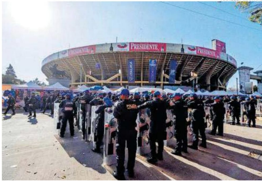
Más de mil elementos fueron desplegados desde las 10:00 horas de ayer