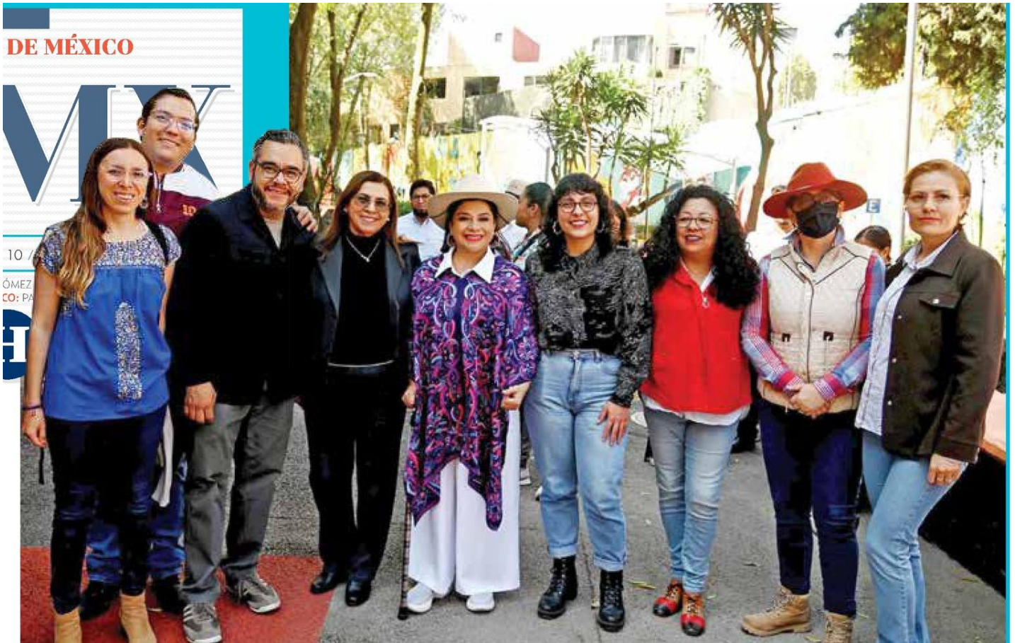
GOBIERNO. Clara Brugada afirmó que al dejar a un lado los temas políticos se dan resultados a la gente.