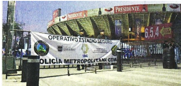
El partido de anoche fue el primer evento tras la suspensión.