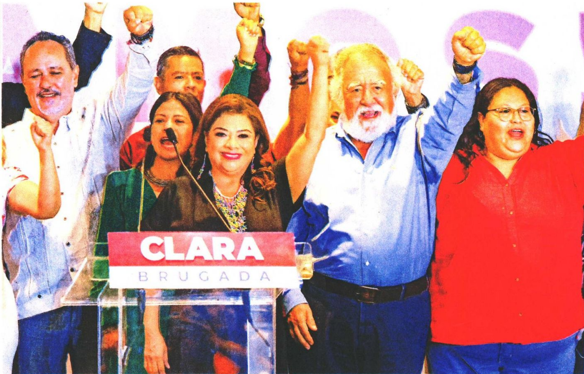
Acompañada de su equipo y líderes partidistas, Clara Brugada ofreció su primer mensaje, en el que destacó que tras la jornada electoral empieza una etapa de reconciliación, de trabajo plural, porque esta Ciudad es plural.