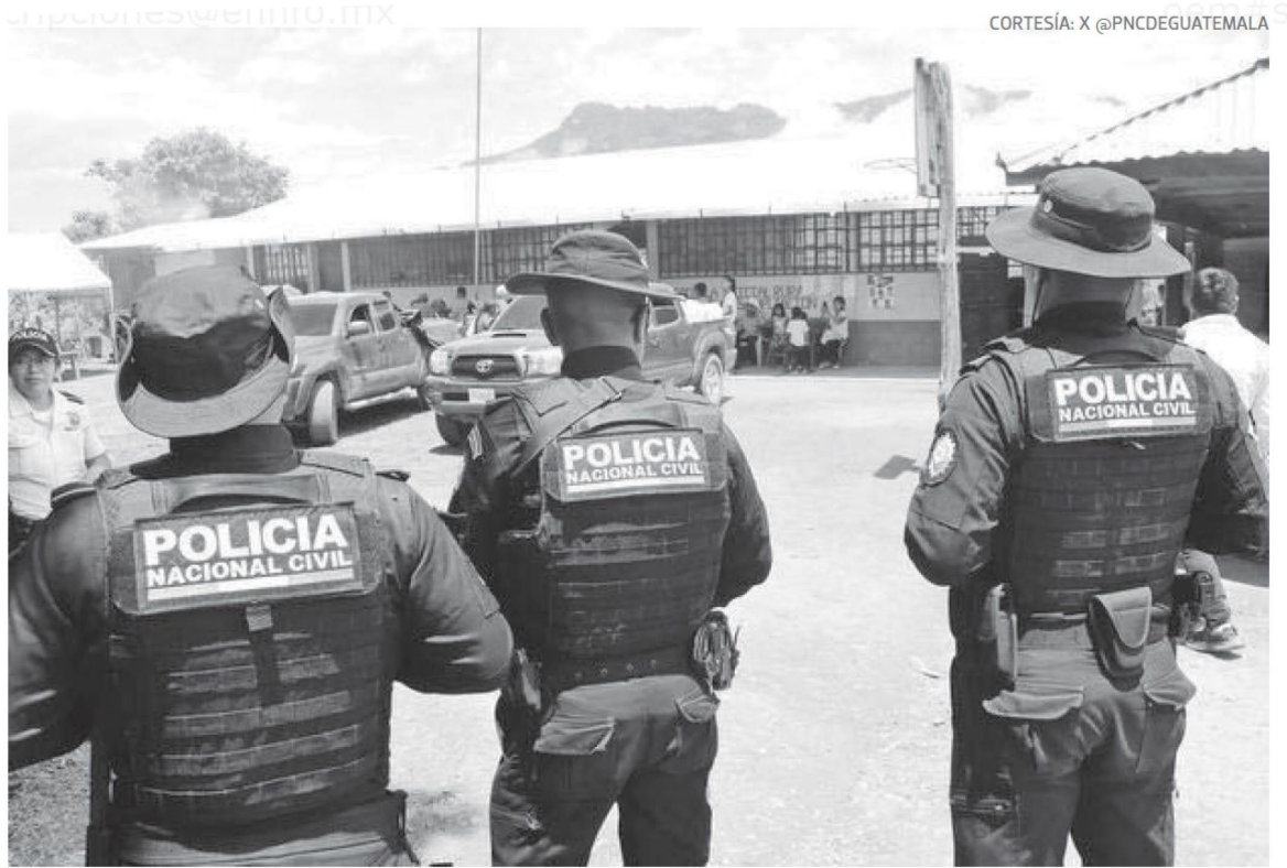
Policías incrementan la seguridad en la zona fronteriza y en los albergues de migrantes