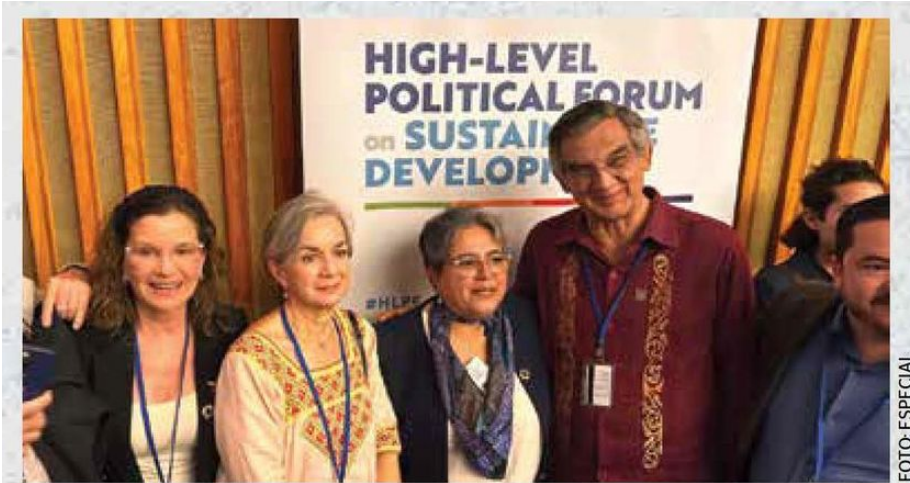
El 15 de julio de 2024 , Américo Villarreal, gobernador de Tamaulipas, acudió como parte de la delegación mexicana al Foro Político de Alto Nivel sobre Desarrollo Sostenible en la sede de la ONU.