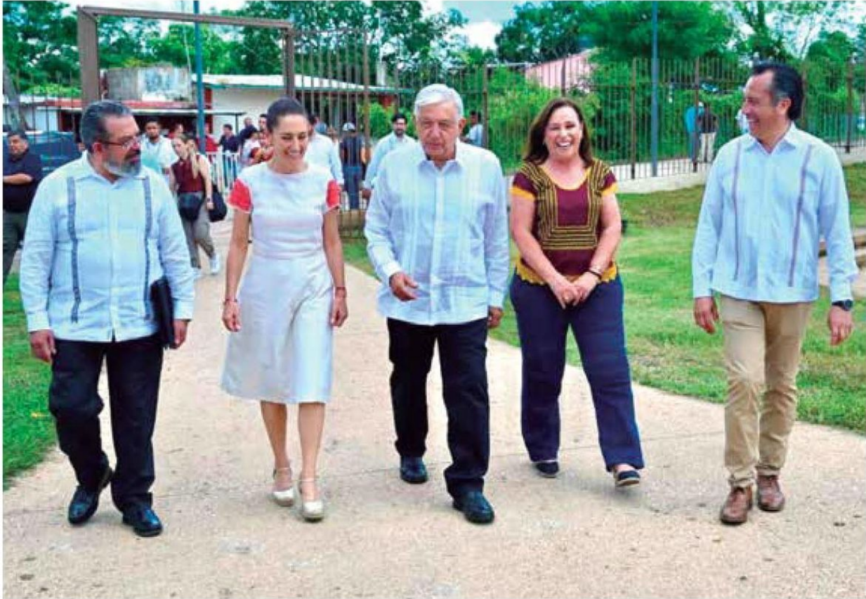
● LABOR. Sheinbaum y López Obrador estuvieron acompañados del titular de la SICT, Jorge Nuño.