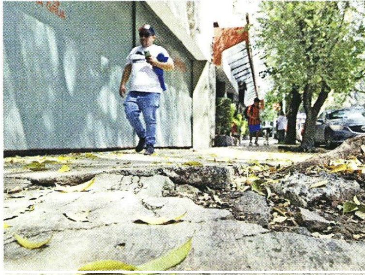
■ Usuarios de la vía critican que para sortear pendientes y baches en plena banqueta tengan que transitar por la calle.