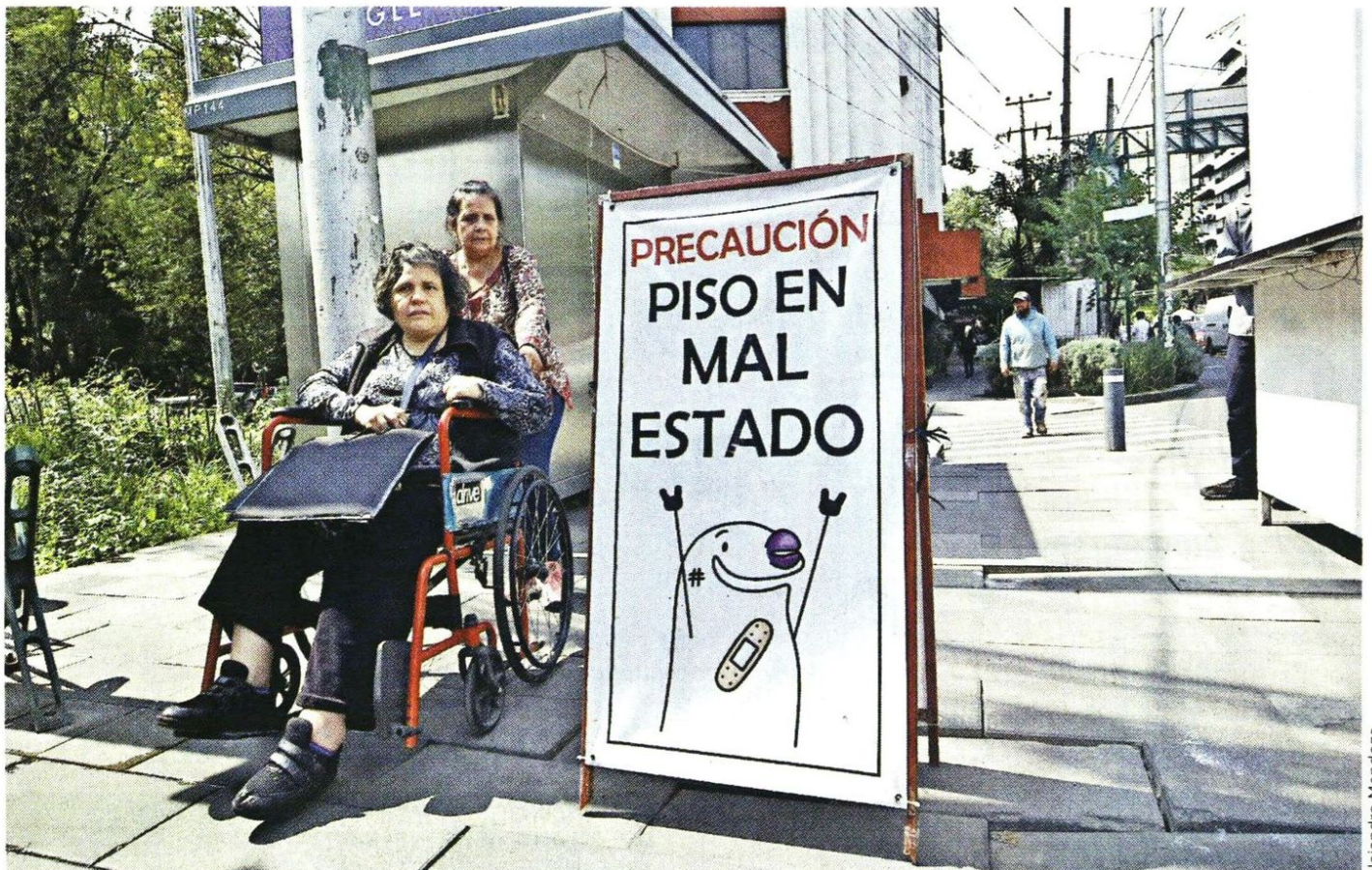
AVISO. Ante el mal estado de las banquetas, vecinos colocaron un letrero que pide a peatones caminar con precaución.