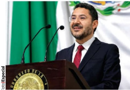
MARTÍ BATRES, ayer al rendir su último informe de Gobierno.

EL JEFE de Gobierno presume en Sexto Informe que presas del Cutzamala ya tienen más agua que en 2023; revive tema de contaminación de pozos en BJ... pág. 16