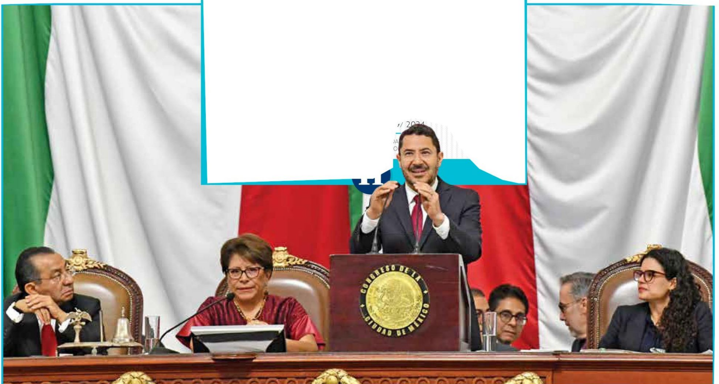
• PROTOCOLO. Al acto acudieron los alcaldes, miembros del gabinete, legisladores federales y, en representación del Presidente, la secretaria de Gobernación.