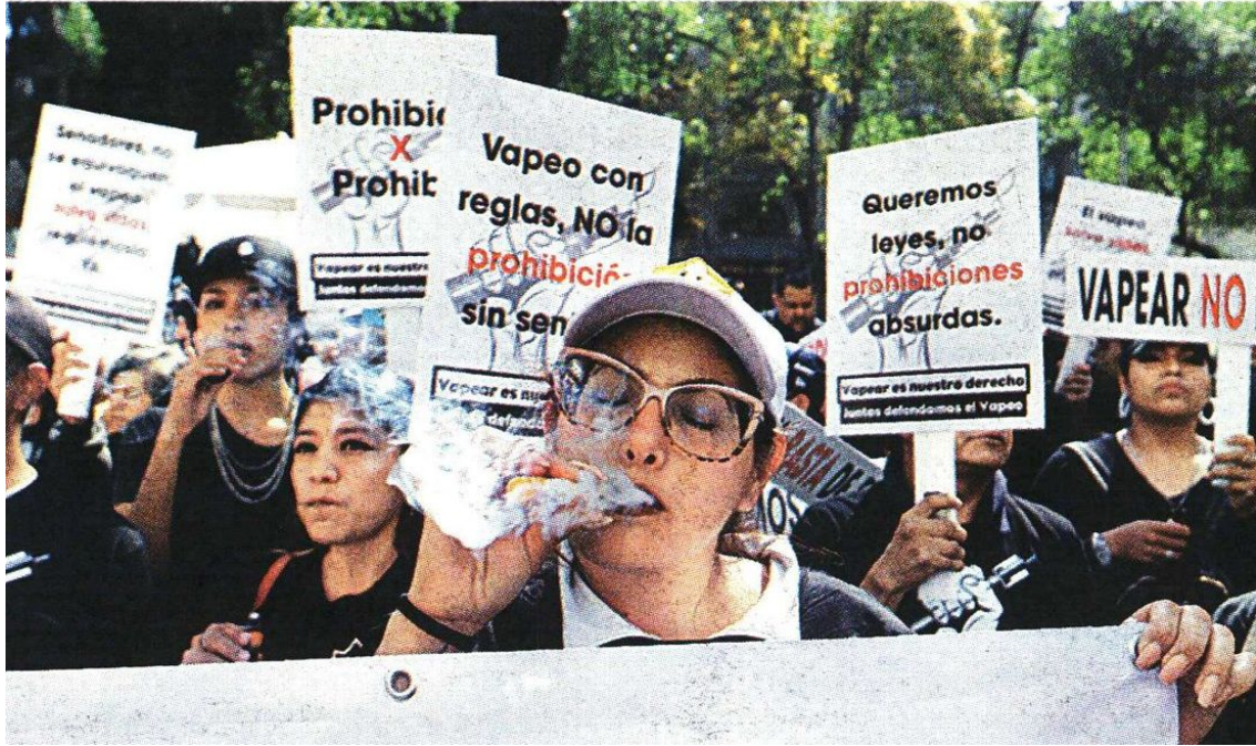
Protesta contra la prohibición de vapeadores, tema que se discute hoy en el Senado. JAVIER RÍOS