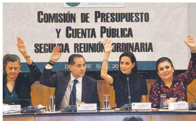
Votan y aprueban. Reducen presupuesto de Presidencia, Segob y SE, entre otras.

La mayoría de Morena y aliados en la Cámara de Diputados aprobó hacer ajustes y reasignaciones por hasta 44 mil 421 millones de pesos al Proyecto de Presupuesto de Egresos para 2025. De acuerdo con el dictamen aprobado anoche en la Comisión de Presupuesto, con 34 votos a favor y 12 en contra, el mayor recorte se haría al Poder Judicial con 14 mil 42 millones de pesos, y al INE con 13 mil 476 millones. El coordinador de Morena, Ricardo Monreal, sostuvo que de los 27 mil millones que le dejan al INE, podría destinar 7 mil millones a la elección judicial.—Victor Chávez / PÁG. 42