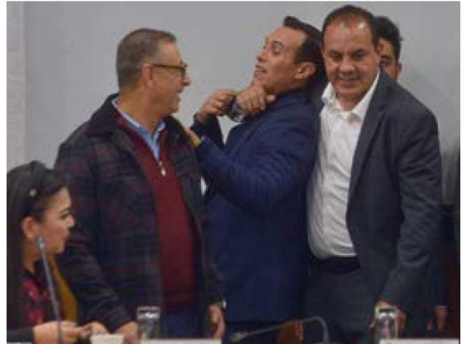
Sesión. El diputado morenista Cuauhtémoc Blanco [der.], ayer, en San Lázaro.

También el Congreso de la Unión se aplica un recorte de 540.5 millones de pesos.