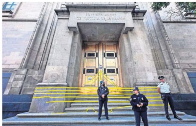
Es extenso el número de candidatos entre los que se debe elegir a los juzgadores en la elección de junio próximo, consideran analistas.

49 mil 398 # ASPIRANTES se considera participarán en las elecciones de 881 jueces federales.