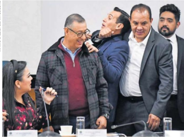
El diputado Cuauhtémoc Blanco bromea durante la sesión del día de ayer de la Comisión de Presupuesto de la Cámara Baja.