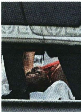
La abogada recibió tres tiros, que le perforaron la cabeza y el tórax.