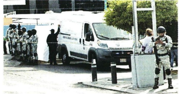
La zona del homicidio, donde hallaron nueve casquillos, fue acordonada y resguardada por fuerzas locales y federales.