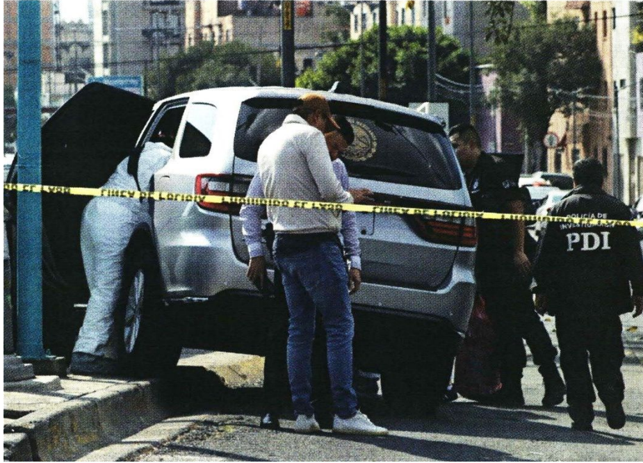
ROMA SUR. Tras el ataque a balazos, la camioneta que conducía la litigante chocó.