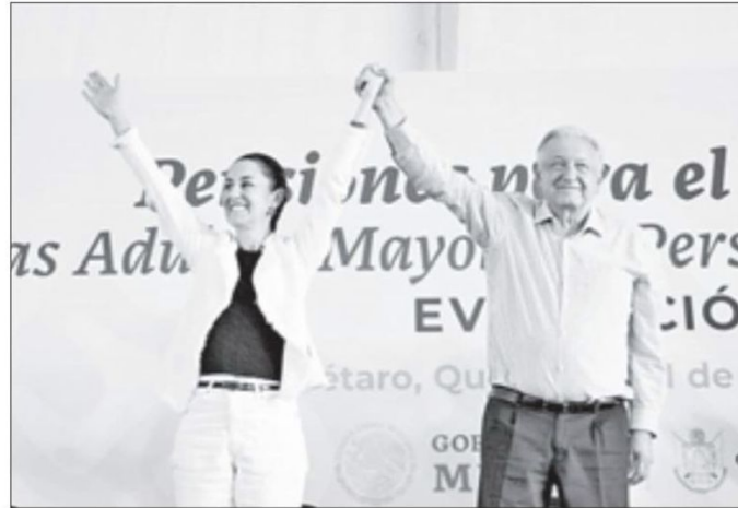
▲ Claudia Sheinbaum y Andrés Manuel López Obrador realizaron este domingo una gira conjunta por Querétaro.