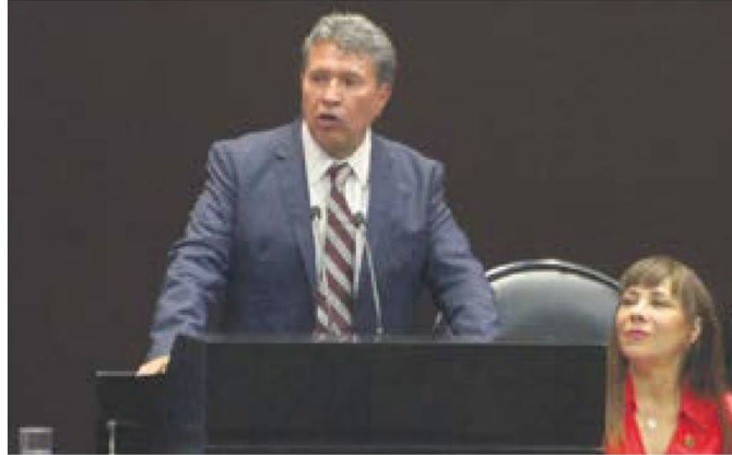
Anuncio. Ricardo Monreal, líder de Morena en la Cámara de Diputados.