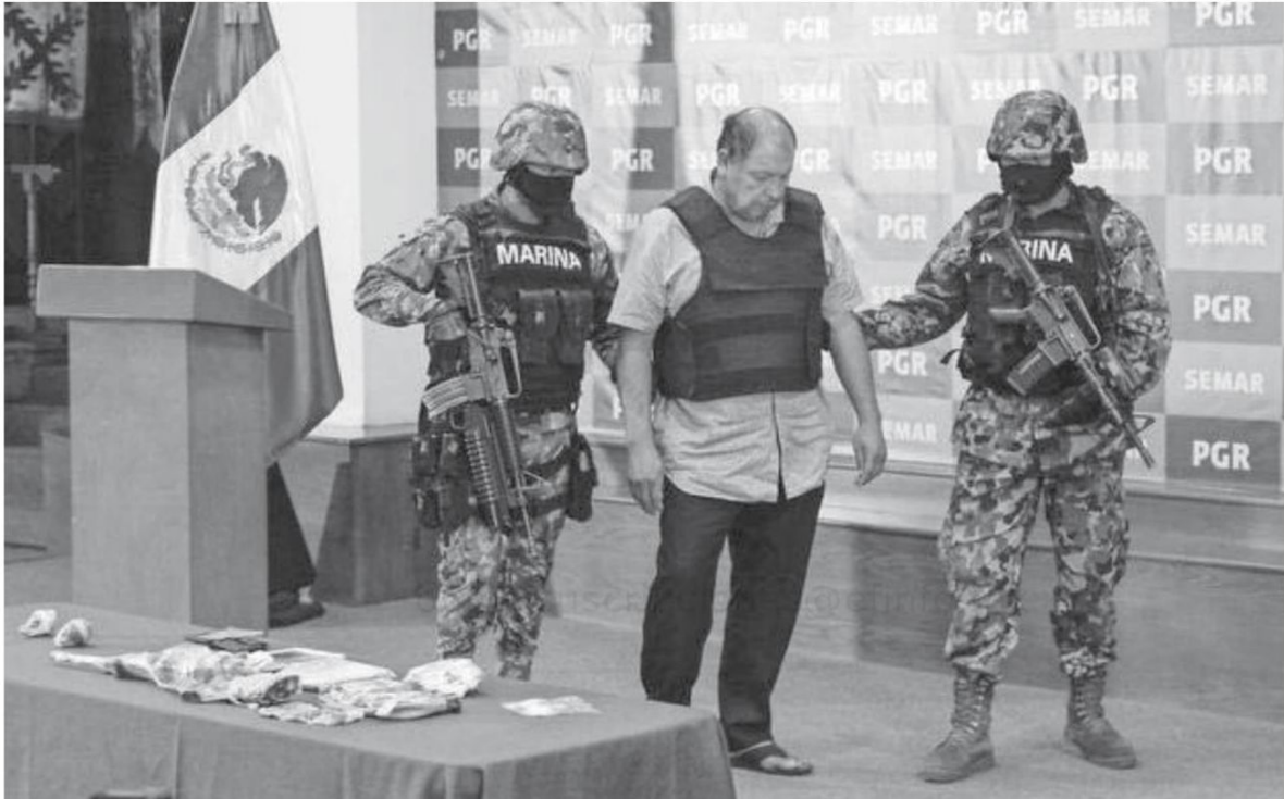
Mario Cárdenas Guillén, El M1 o El Gordo, fue detenido por la Marina en 2012 y podría salir en 2026