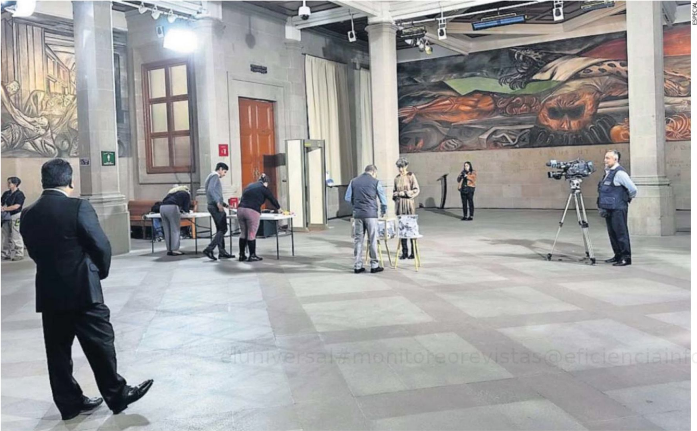
Trabajadores de la SCJN colocaron ayer al mediodía urnas para emitir su voto en el área de murales, mientras se efectuaba la sesión del pleno en la Corte.