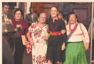
“Llegó una mujer Presidenta y vamos a reconocer el trabajo de las mujeres. Ahora van a tener un apoyo para ustedes”, celebró.

Destacó que este nuevo programa representa un reconocimiento a todas las mujeres que antes de la 4T fueron olvidadas y ahora serán prioridad con la primera mujer Presidenta.