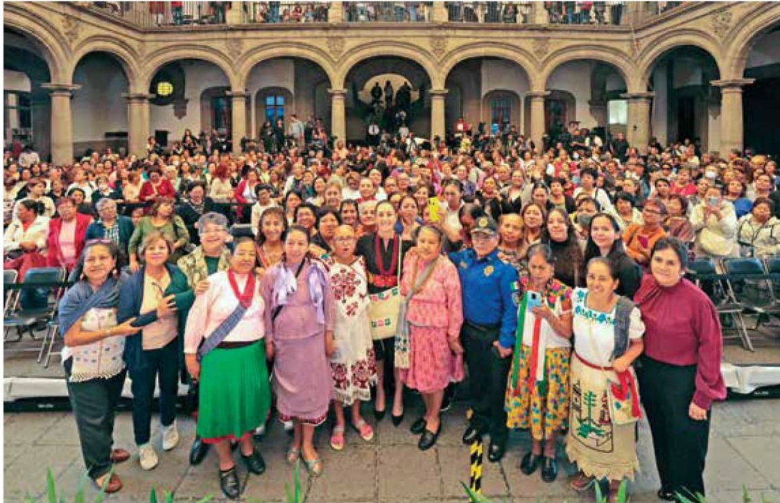
CERCANA | ● Sheinbaum encabezó un encuentro con mujeres en el Museo de la Ciudad de México.