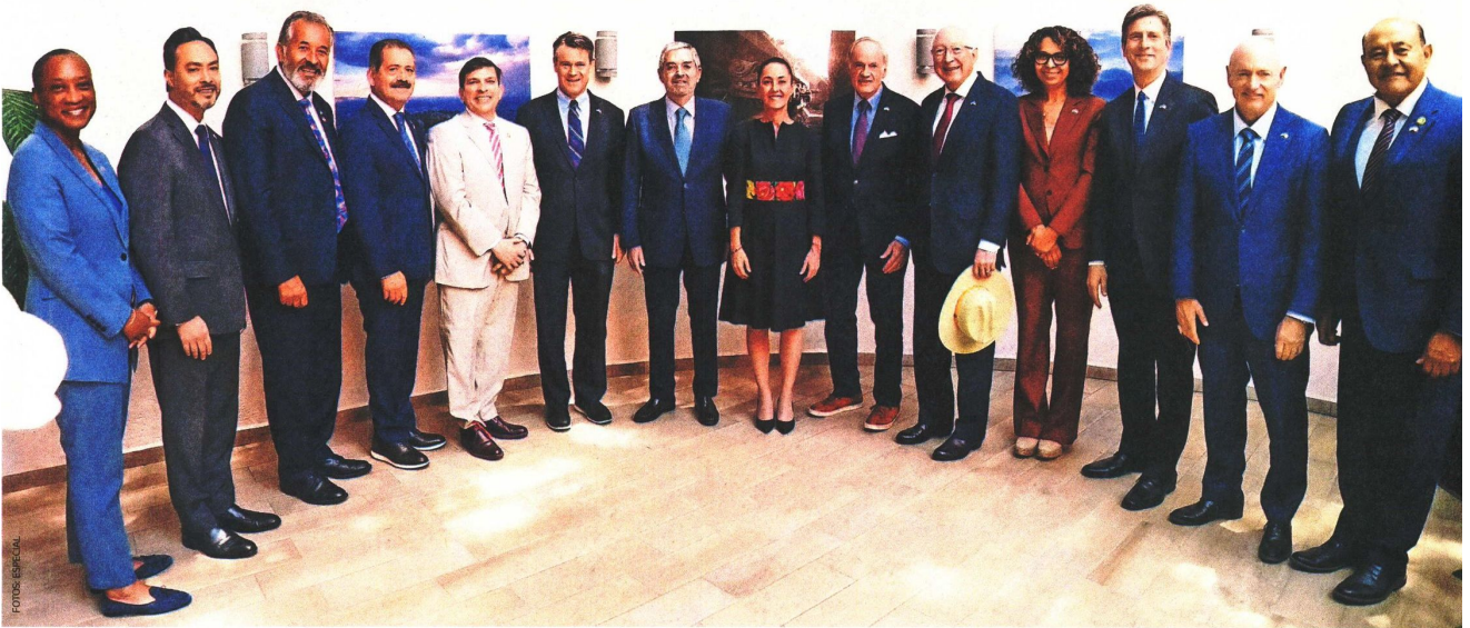
Senadores y diputados federales de Estados Unidos se reunieron ayer con Claudia Sheinbaum, futura presidenta de México, y con Juan Ramón de la Fuente, quien será el secretario de Relaciones Exteriores.

de mujeres mayores de 60 años hay en México, indica Verónica Montes de Oca, especialista en envejecimiento por la UNAM.