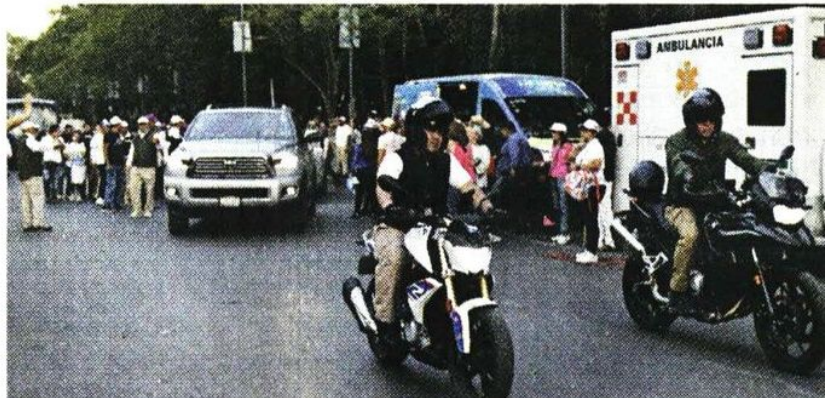
Las candidatas y el candidato a la Presidencia tuvieron protección por parte de elementos del Ejército.

En ese mismo mes, en Linares, Nuevo León, dos monitoristas quedaron en el fuego cruzado de dos bandas criminales que se enfrentaron. Se resguardaron en una zanja.