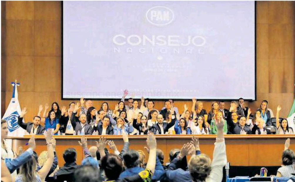
El PAN celebró ayer su Consejo Nacional en la sede de la CdMx