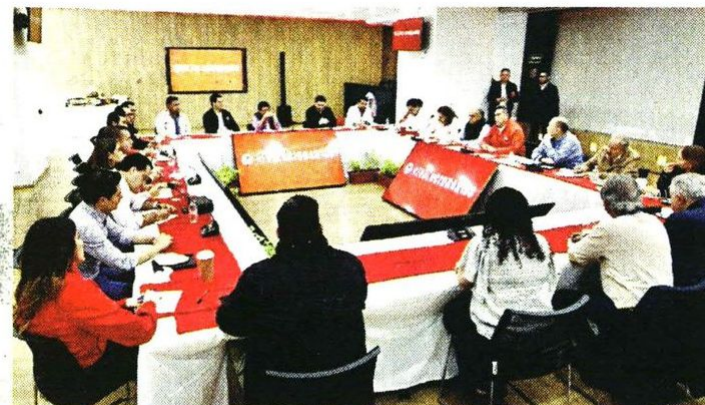
El dirigente nacional del PRI, Alejandro Moreno, encabezó ayer una reunión previa a la 24 Asamblea Nacional del partido.

"Alito" Moreno señaló, además, que los votantes mexicanos demostraron un deseo de balancear el poder en el Congreso.