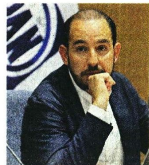
Marko Cortés encabezó la sesión del Consejo del PAN.