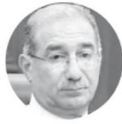
ALBERTO PÉREZ DAYÁN Ministro de la Corte

“Resolver en el sentido de la propuesta sería responder a una insensatez, llevada irresponsablemente al texto supremo con otra insensatez”