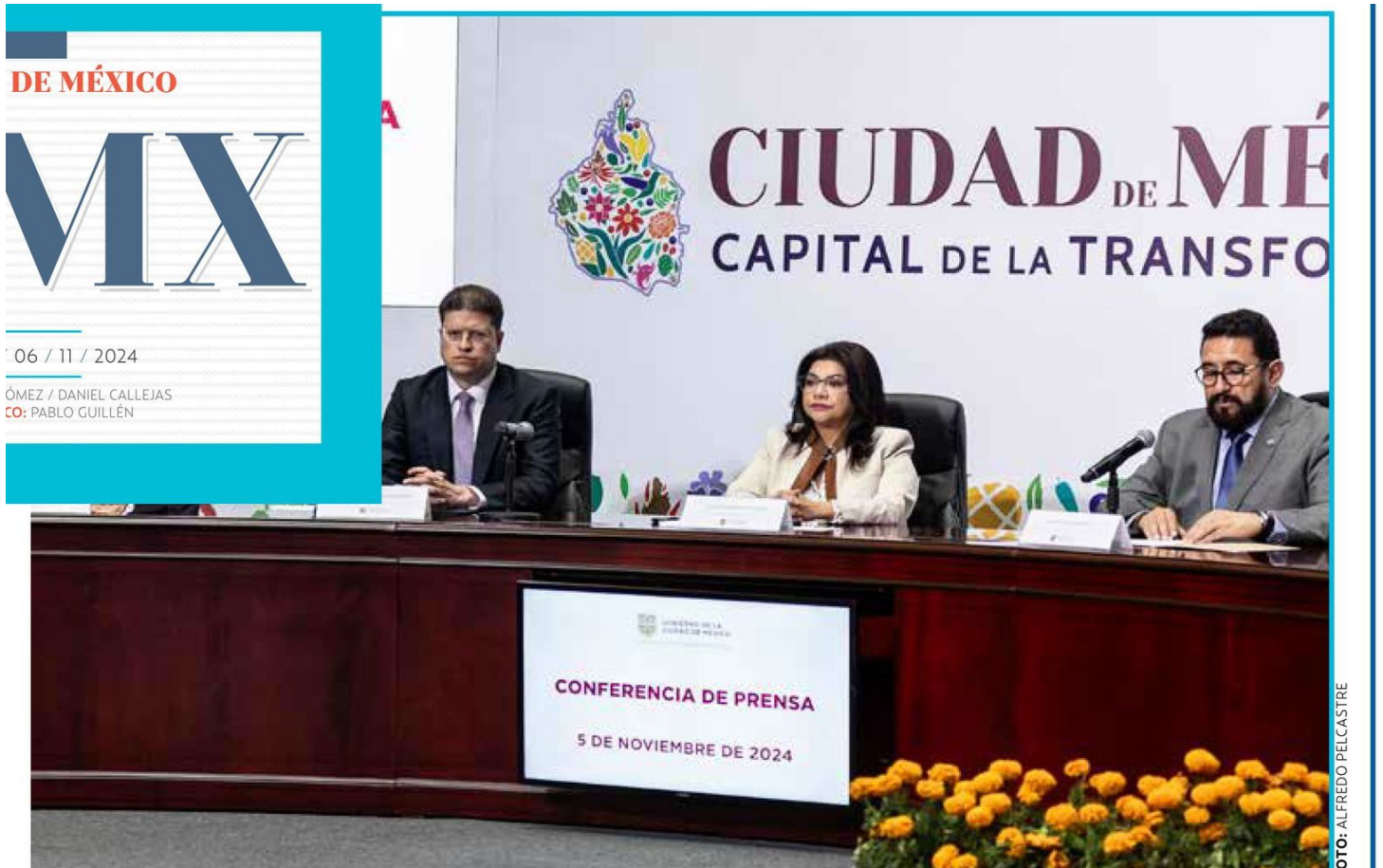
OFICIAL. La jefa de Gobierno ofreció detalles de los arrestos junto al titular de la SSC y el encargado de la Fiscalía.