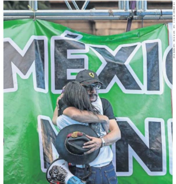
Trabajadores del Poder Judicial rompieron en llanto al conocerse la decisión de la Suprema Corte.

a favor recibió el proyecto contra la reforma judicial en la Corte, en vez de los 8 necesarios para avalarlo.