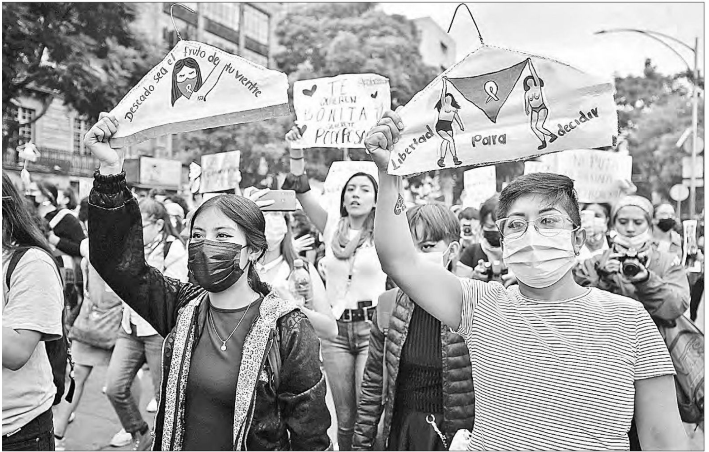
▲ Organizaciones feministas han marchado en demanda de la despenalización total del delito de aborto, como la realizada el 28 de septiembre de 2022 en la CDMX, en el contexto de la Acción Global por el Acceso al Aborto Legal y Seguro.

ciativa al pleno para crear la ley de los derechos de la persona no nacida, para reconocer jurídicamente al ser humano desde su existencia como feto o embrión.