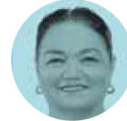
DULCE MARÍA SAURI