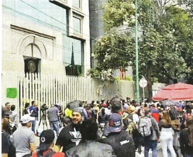
Trabajadores del Poder Judicial que rechazan la reforma se manifestaron frente a la sede del Conejo de la Judicatura.