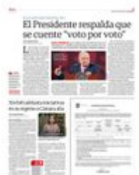
LA EXCANDIDATA presidencial Xóchitl Gálvez en un videomensaje, ayer.