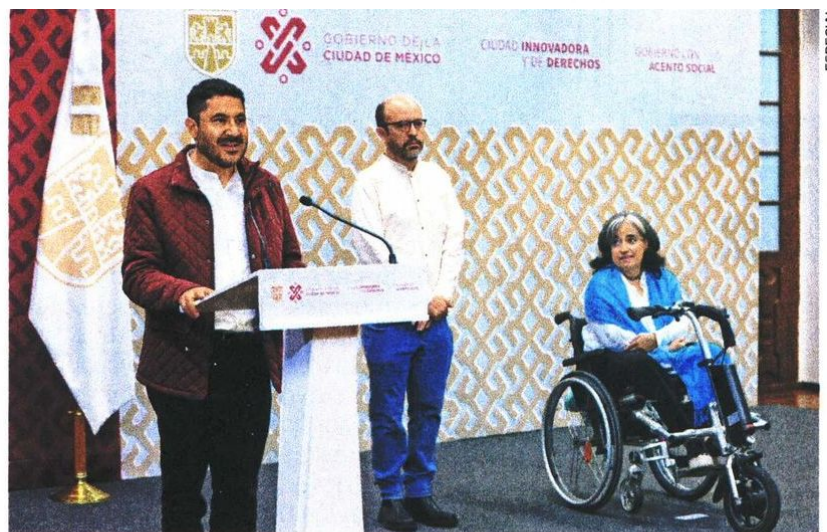
En conferencia, el jefe de Gobierno informó que ya hubo una reunión entre el equipo de Clara Brugada y funcionarios capitalinos.