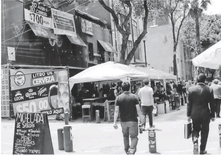
Los negocios de esta alcaldía encabezan la lista con más quejas ciudadanas