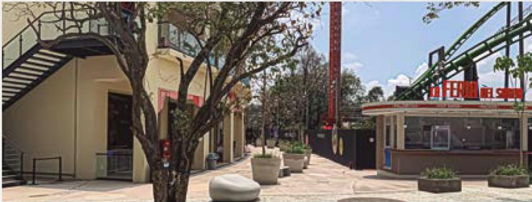
Anque se prometió que el 17 por ciento de la superficie de Parque Aztlán serían áreas verdes, apenas se alcanzan a ver algunas jardineras con arboles de escaso follaje.

19 mil millones 466 mil 361 pesos anuales pagará el Parque Urbano Aztlán en 2024 a la Dirección de Gestión del Bosque de Chapultepec