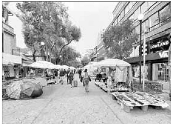
◀▲ Aspectos de las calles Génova y Florencia, en la colonia Juárez, dentro del perímetro conocido como la Zona Rosa. La primera está invadida por decenas de puestos ambulantes, mientras la segunda muestra el deterioro de edificios.

Sin embargo, “algunos han aprovechado la poca vigilancia de las autoridades para construir o remodelar edificios en Niza o Hamburgo, donde no aparece ninguna manta que diga qué están haciendo”, afirmaron vecinos.