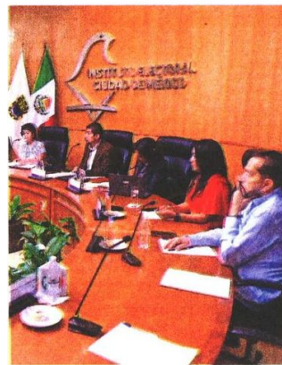
Quejosos indican que el IECM violó derechos político-electorales.

Entre otras pruebas, Morena presenta videos en lo que se observan presuntas irregularidades a las afueras de los consulados. ●