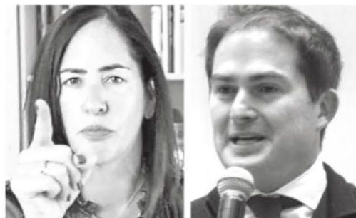
· Va Limón contra Casarín

· A la panista le decomisaron 7 toneladas de despensa para compra del voto en AO.