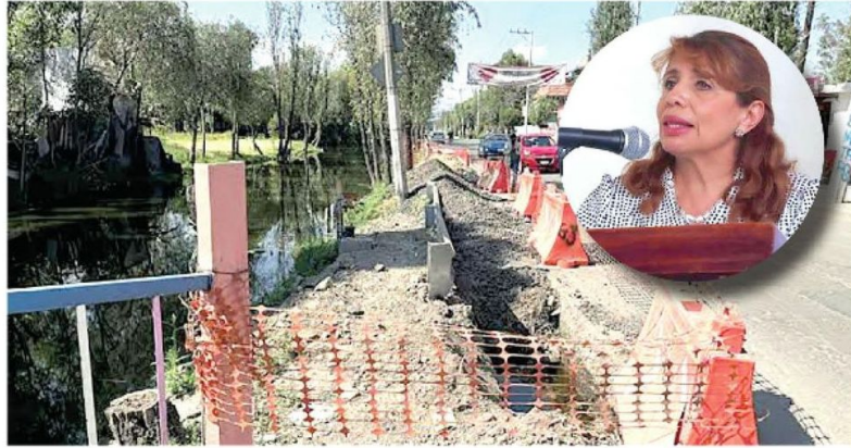
Vanegas ahora será diputada de la próxima legislatura en el Congreso