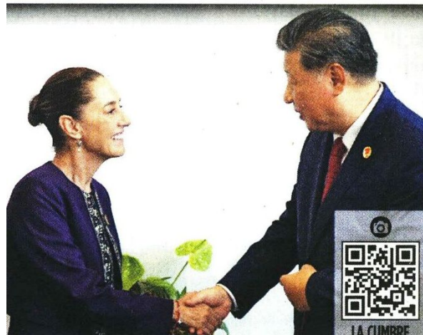
Sheinbaum tuvo reuniones con los presidentes de EU y China.