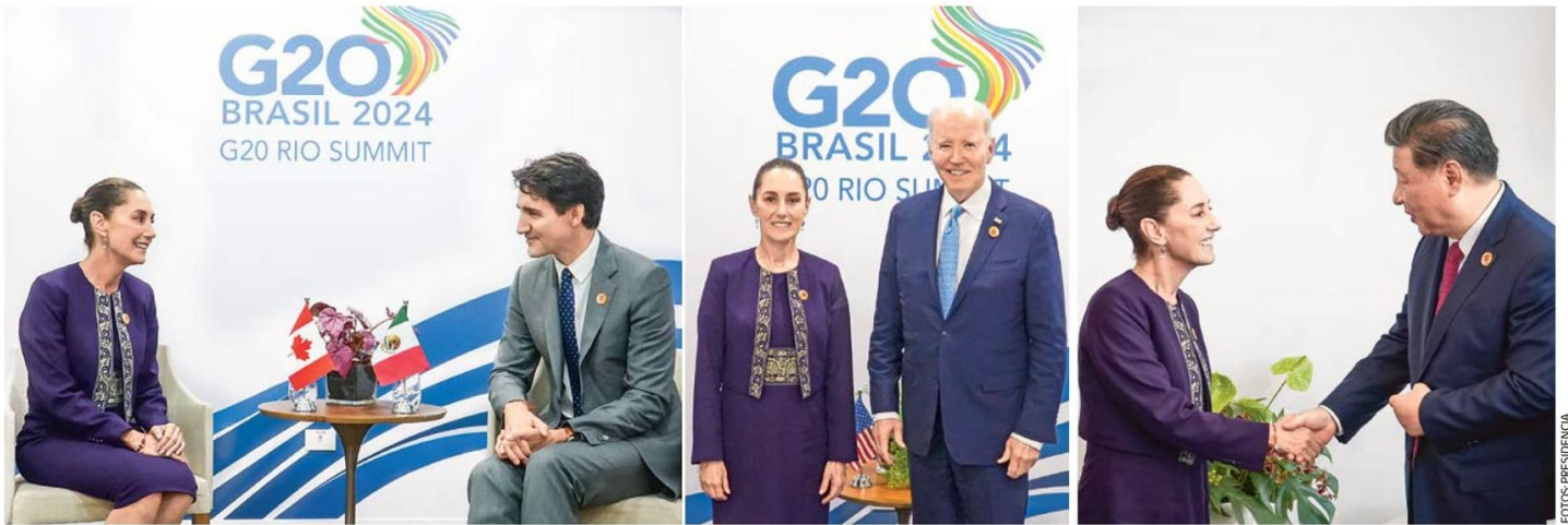
INTERESES COMERCIALES. La mandataria se reunió, por separado, con Justin Trudeau (Canadá), Joe Biden (Estados Unidos) y Xi Jinping (China).