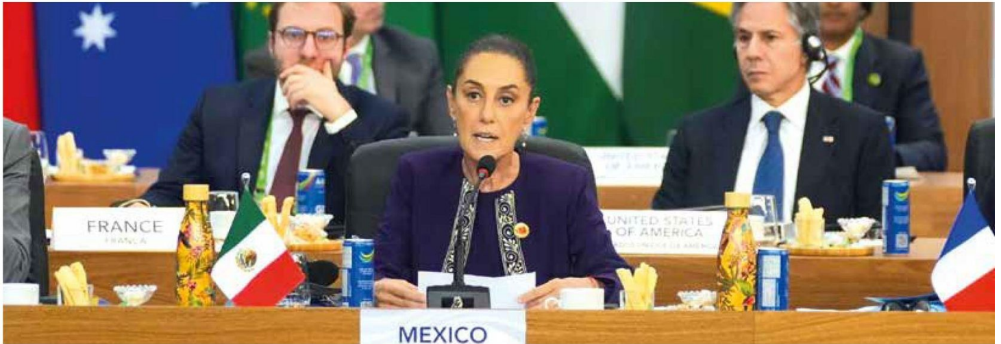
Mensaie. La presidenta Claudia Sheinbaum. aver. en Río de Janeiro. Brasil.