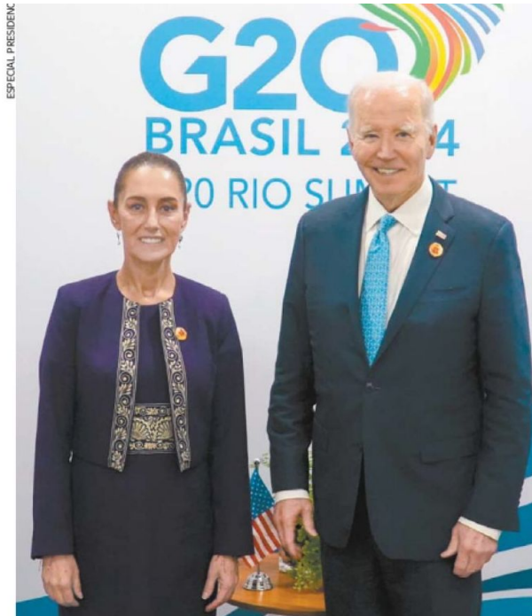
Claudia Sheinbaum y Joe Biden hablaron de la buena relación que hay entre México y EU, así como de la importancia del trabajo conjunto.