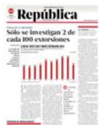
Gráfico: Alejandro Gómez