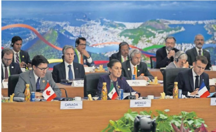
La presidenta de México, Claudia Sheinbaum, ayer en su participación en la reunión del G20.