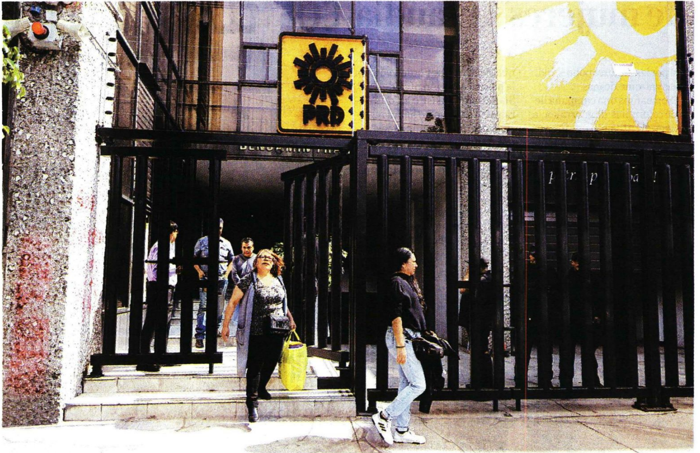
Edificio central de la fuerza política tras la pérdida del registro. JAVIER RÍOS