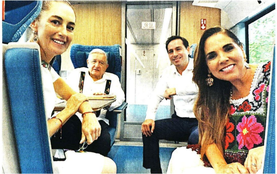
■ El Presidente AMLO, la virtual Presidenta electa, Claudia Sheinbaum, y los Gobernadores de Yucatán y QR, Mauricio Vila, y Mara Lezama, viajaron en el Tren Maya de Mérida a Cancún.