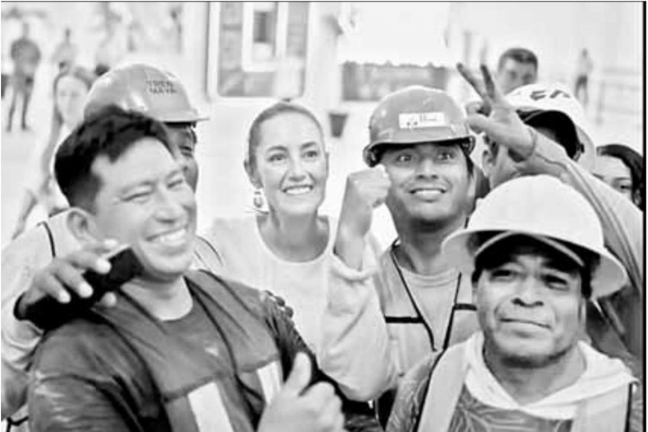
▲ La virtual presidenta electa calificó de "interesantísimo" el recorrido, pues le ha permitido conocer pormenores de la obra ferroviaria.