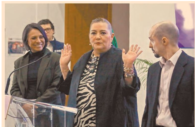
Consejeros del INE , encabezados por Guadalupe Taddei, advirtieron de las afectaciones por el recorte al presupuesto que solicitaron.