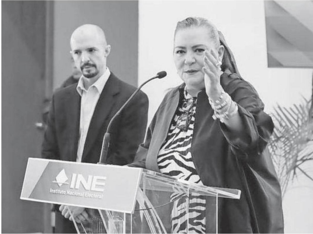
Guadalupe Taddei , presidenta del INE, en la conferencia de prensa de ayer