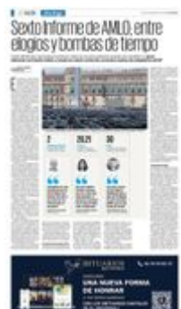
El presidente Andrés Manuel López Obrador entrega hoy al Congreso su Sexto Informe de Gobierno y da un mensaje en el Zócalo.