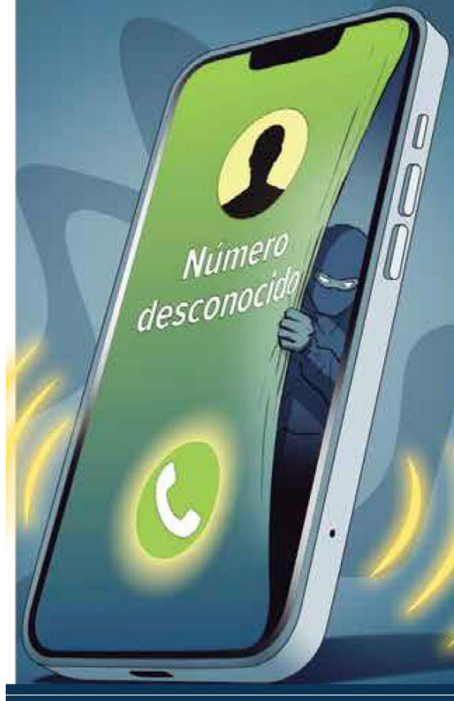
Ilustración: Abraham Cruz

Una vez que confirmes que tu familiar está bien o que no debes realizar ningún trámite, denuncia ante las autoridades.