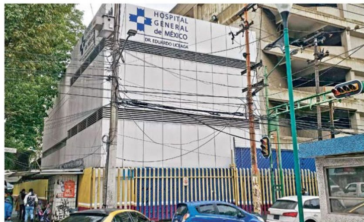
ABASTO. En entrevista con pacientes, familiares de internos y personal médico, se constató que este sanatorio brinda servicios de salud sin problemas en el suministro.

litros del vital líquido recibió el nosocomio a través de pipas entre enero y marzo del 2024