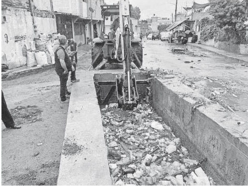
Este es el tapón de basura en la colonia Las Venitas