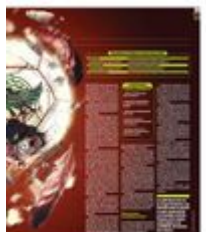
Los dirigidos por Lozano solo tuvieron chispazos de buen juego, pero no más.