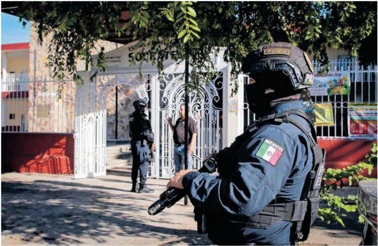
Escuelas de Culiacán lucieron vacías, pese al operativo de seguridad para el regreso a clases