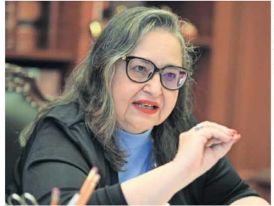
La presidenta de la Suprema Corte turnó el asunto al ministro Juan Luis González Alcántara Carrancá.

“Se consulta al tribunal pleno sobre la procedencia de la controversia (...) respecto del cumplimiento de las formalidades del procedimiento”