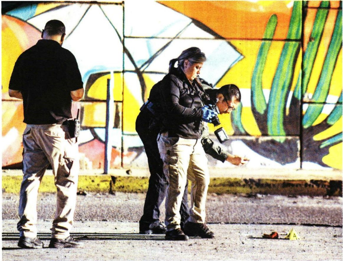
Peritaje sobre los restos arrojados cerca del libramiento Benito Juárez.