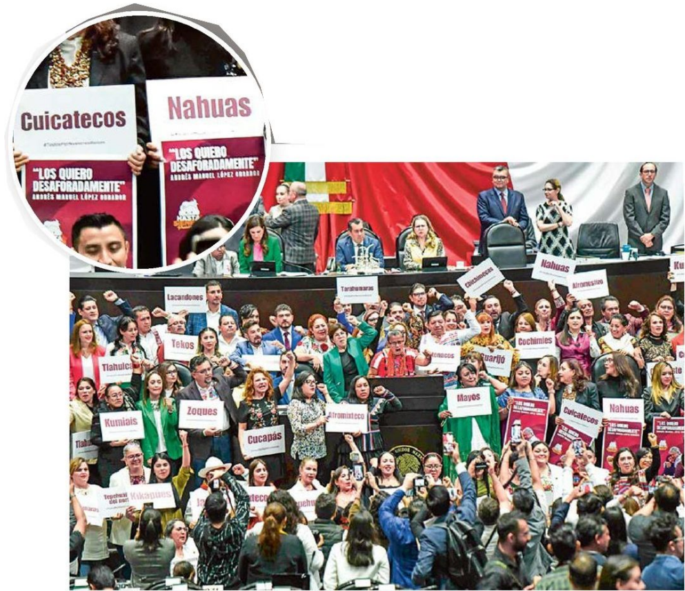
SANLÁZARO. Diputados de la Cuarta Transformación se manifestaron en tribuna ayer a favor de la reforma en pro de los pueblos indígenas.